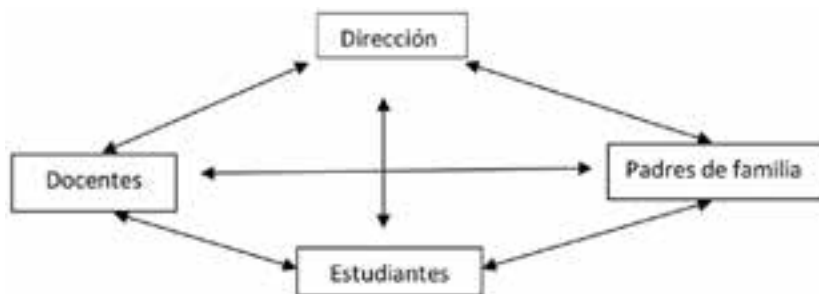
Gráfico 1. Diagrama de Relaciones

El clima escolar se identifica como el conjunto de relaciones de calidad que se da entre los miembros de una institución educativa y los sentimientos de aceptación o de rechazo que existe entre ellos. En consecuencia, se puede hablar de una multiplicidad de relaciones: entre la dirección y los docentes, entre docentes y estudiantes, entre docentes y padres de familia, como entre estudiantes y padres.