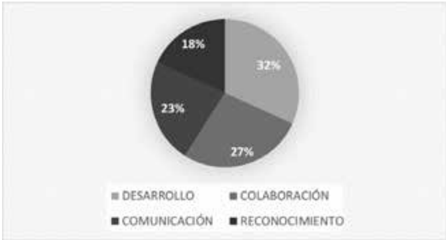
Gráfico 1. Aporte de la Escuela IKA a la comunidad

Al tenor de los resultados conseguidos, se puede observar cómo no termina de establecerse una buena relación entre la escuela y la comunidad. Se han distinguido cuatro grandes categorías como resultado del análisis del contenido realizado, mismas que representan acciones claves a desarrollarse.