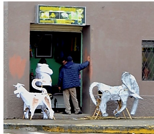
Figura 3. Fotos del local de pirotecnia.

Finalmente, de la información recopilada en los diarios de campo, se sintetiza la siguiente información.