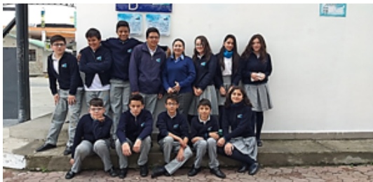
Figura 4. Foto grupal de los miembros del grupo.