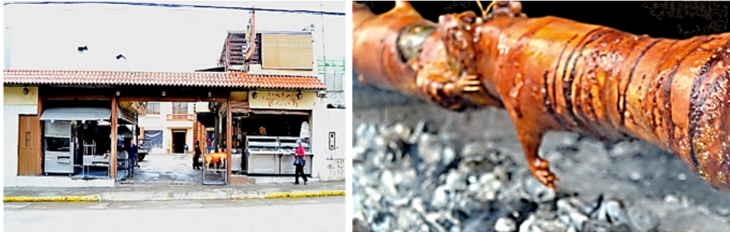
Figura 2. Fotos del local Marabú.

gastronómicas provenientes de Quito y otras ciudades del país, ellos vienen a hacer prácticas de servicio y en algunos casos, a conocer paso a paso la preparación de éstos alimentos tradicionales.