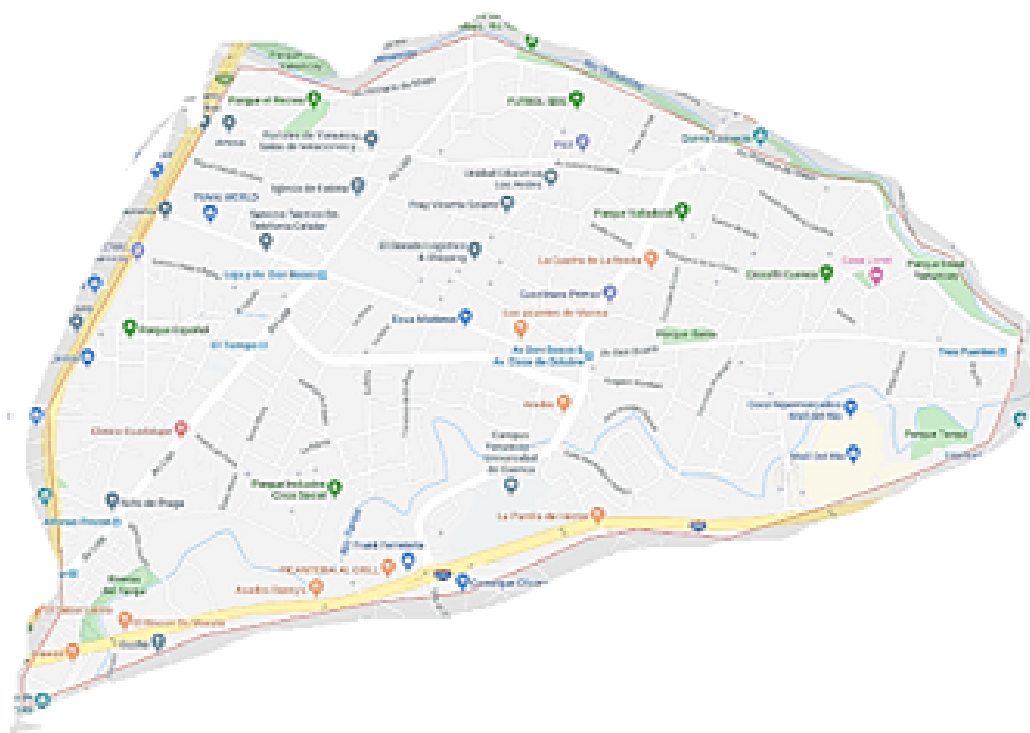
Figura 1. Parroquia Yanuncay.

Para la tercera actividad, nos apoyamos en los recursos tecnológicos como es el gloogle maps (Figura 1), con esta herramienta pudimos localizar el mapa de la parroquia Yanuncay.