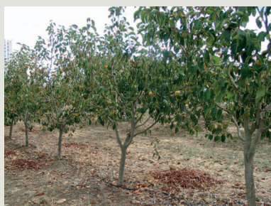
Figura 9 - Árvore da cultivar O'Gosho