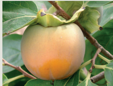
Figura 4 - Fruto da cultivar Rojo Brillante

Com a finalidade de estudar a adaptabilidade desta espécie à região do Baixo Alentejo, O Centro Hortofrutícola da Escola Superior Agrária de Beja (ESAB) instalou em 1996 a cultura do diospireiro.