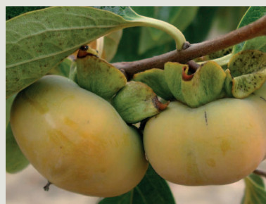
Figura 10 - Fruto da cultivar O'Gosho

mento (fase que começa 10 a 15 dias depois da floração do pessegueiro), o que só acontece, se se verificarem geadas muito tardias de Primavera (Gonzalez e Ruiz, 1985).