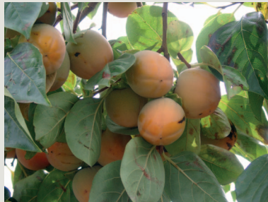
Figura 3 - Árvore e fruto da cultivar Rojo Brillante