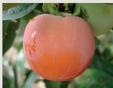
Figura 6 - Fruto da cultivar Faufau