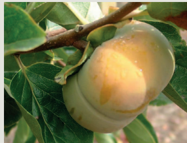
Figura 2 - Fruto da cultivar Fuyu