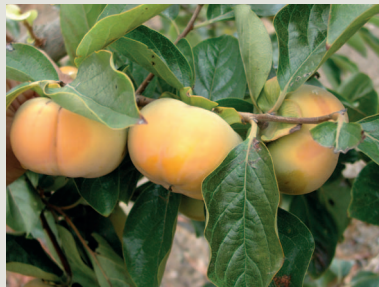
Figura 1 - Árvore e fruto da cultivar Fuyu

Agrícolas e das Importações Agro-Alimentares, 2011). Até 2013, a DRAPAlg (Direção Regional de Agricultura e Pescas do Algarve) pretende duplicar o número de hectares da plantação de abacates e dióspiros ( http://www.algarveprimeiro.com ).