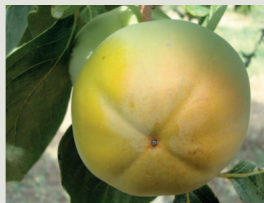
Figura 8 - Fruto da cultivar Coroa de Rei