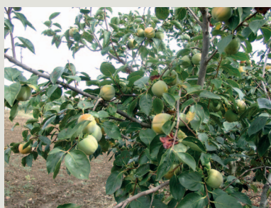
Figura 5 - Árvore da cultivar Faufau

Fruto: Calibre de médio a grande e forma achatada, com secção transversal circular