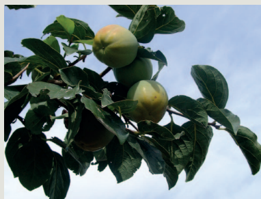
Figura 7 - Árvore e fruto da cultivar Coroa de Rei