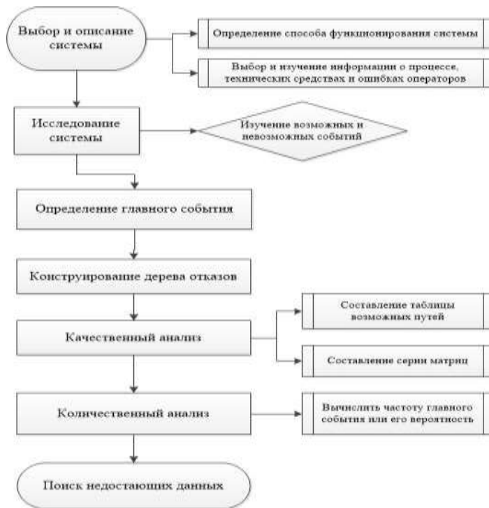
Рисунок 1 – Алгоритм строения «дерева-отказов»

Вариационную модель развития ЧС (останов трансформатора и его составная часть взрыв) на объекте строим в виде «дерева-отказов», которое представлено на рисунке 2.