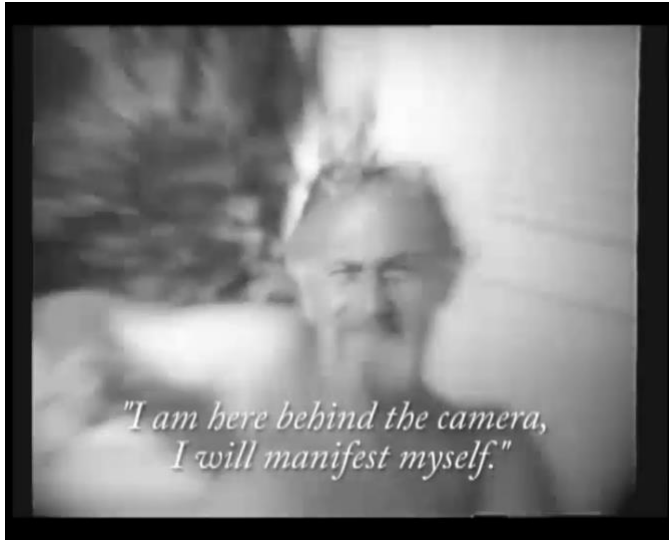
Abbildung 9, Still aus Video et phénoménologie