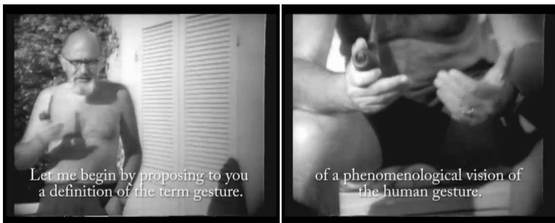
Abbildung 1, 2, Stills Vidéo et phénoménologie

Im Video Vidéo et phénoménologie , das 1974 in Zusammenarbeit von Fred Forest mit Flusser entstand, umreißt Flusser seine „Theorie der Gesten“ 690 in einer ungewöhnlichen Weise: Als Video, gedreht von Fred Forest, im Dialog von Forest und Flusser. Flusser erläutert auf einer Terrasse, in sommerlicher Bekleidung (Shorts und Sandalen), sein Interesse für Gesten, Forest filmt ihn mit der Video-Kamera, zoomt, schwenkt und verbindet Detailaufnahmen ohne Schnitt mit Halbtotale.