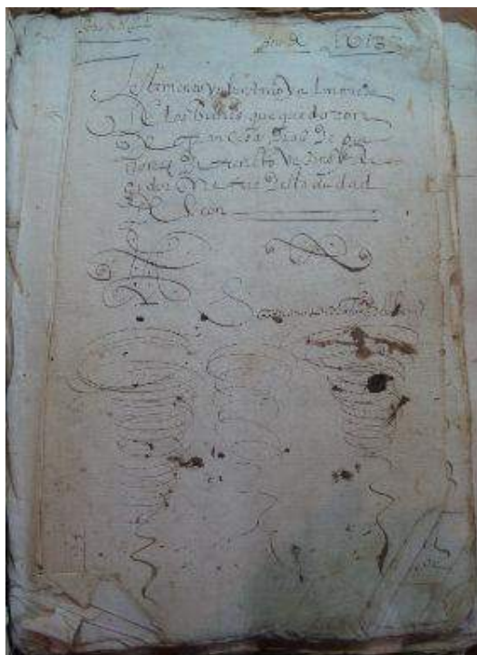
Fig. 1. Testamento, inventario y almoneda de los bienes de Francisco Díaz de Quiñones , AHPLe, Protocolos Notariales de Pedro López de Vivero, sig. 107, caja 75, León, 24 de marzo de 1613, f. 759r, fotografía del autor, 2015.