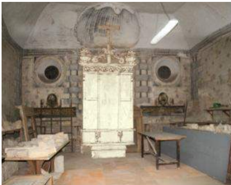
Fig. 5. Recreación del retablo, según su traza, en la capilla de los “Díaz” o de la “Magdalena” en la Real Colegiata de San Isidoro de León, diseño de Miguel Mielgo Torices, 2017.