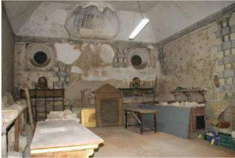
Fig. 3. Vista interior de la capilla de los “Díaz” o de la “Magdalena” en la panda este del claustro procesional de la Real Colegiata de San Isidoro de León, fotografía del autor, 2017.