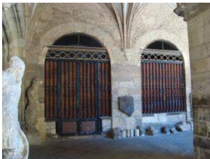
Fig. 2. Vista exterior de la capilla de los “Díaz” o de la “Magdalena” en la panda este del claustro procesional de la Real Colegiata de San Isidoro de León , fotografía del autor, 2017.