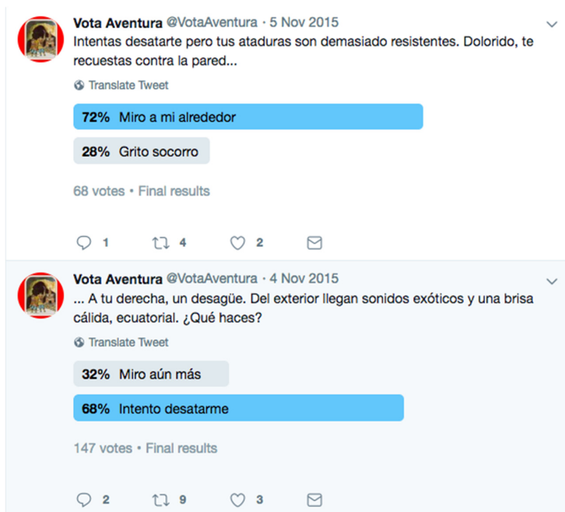
Figura 2. Captura de pantalla de @VotaAventura (2015)