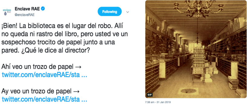
Figura 3. Captura de pantalla @enclaveRAE (2019)

La segunda aventura se publicó el 15 de febrero de 2019 y se centraba en la corrección ortotipográfica. La narrativa de presentación era la siguiente: