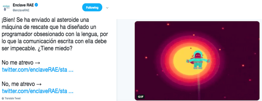
Figura 4. Captura de pantalla @enclaveRAE (2019)

Esta vez su misión como héroe lingüístico es conseguir que la astronauta María Fernández llegue sana y salva a casa desde el asteroide 3251, donde se ha quedado atrapada. ¿Se ve capaz?