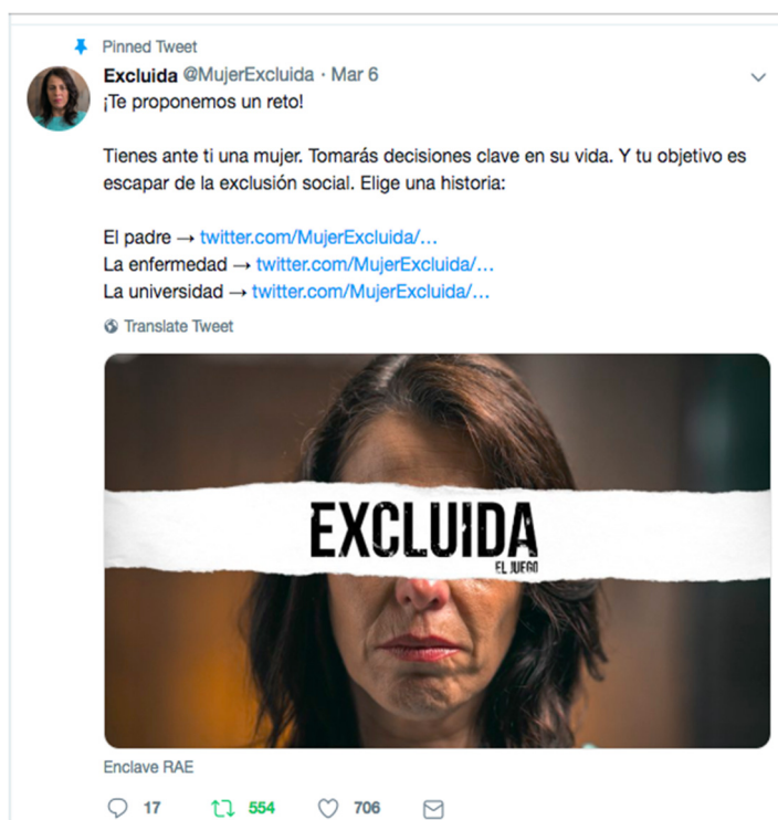
Figura 5. Captura de pantalla de @MujerExcluida (2019)

La primera de ellas, @MujerExcluida fue presentada a modo de juego por la Fundación ADECCO, con la intención de reivindicar el trabajo como medio para evitar la exclusión social de la mujer. El proyecto, disponible en la web www.excluida.org , Twitter y YouTube, presentaba tres historias de exclusión basadas en entrevistas a mujeres reales.