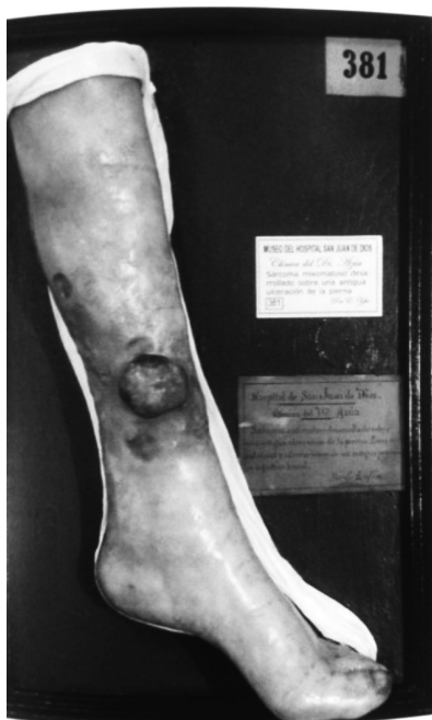
Fig. 2.- Moldes de cera del Museo Olavide de la Academia Española de Dermatología y Venereología.

Si la obra de Alfaro debe ser considerada como un canto de cisne, en este caso no es así. Olavide en todo momento es conscien-