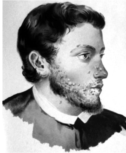
Fig. 3.- Ilustración de González Santos para el Manual de Enfermedades de la Piel de Ramón de la Sota.

en estas ilustraciones es la presencia de varias imágenes de un mismo proceso para facilitar la comprensión de las diferentes formas clínicas y establecer el diagnóstico diferencial. Las láminas se acompañan de una breve historia clínica en las cuales destaca el buen manejo del idioma por parte del autor, así como su visión humana de la medicina. Sus pacientes son personas ante todo que padecen una enfermedad de la piel con la carga de influencia psicosomática que ello conlleva (fig. 3).