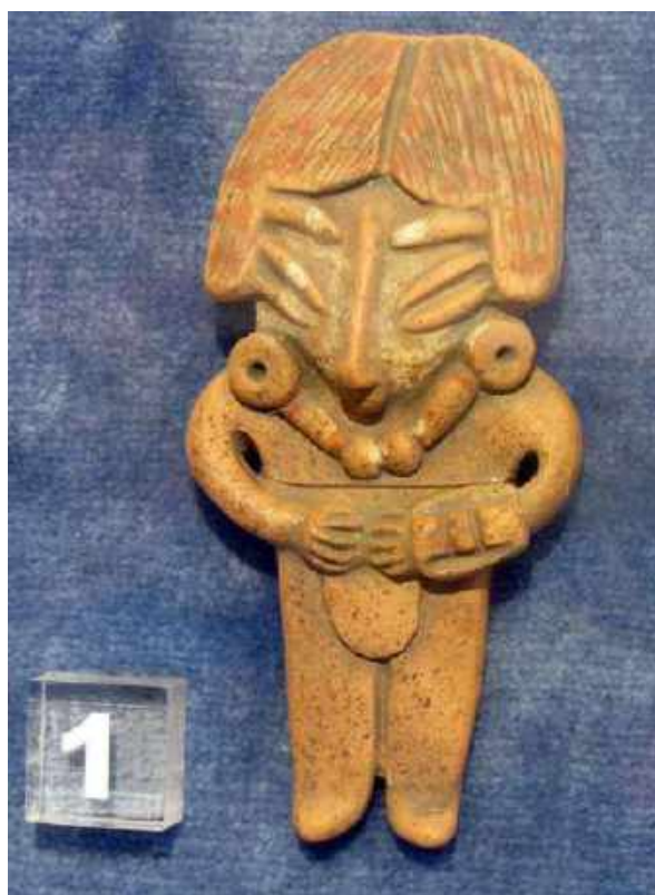
Fig. 5. Réplica , pieza prehistórica del Instituto de América-Centro Damián Bayón.