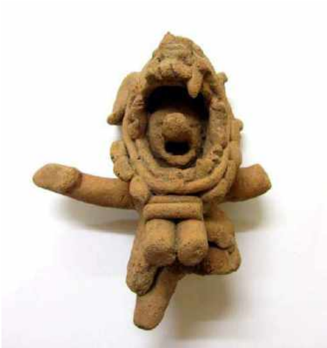
Fig. 1. Ídolo Arcilla , Panamá, Donación del Obispo de Panamá, Museo de Cádiz.