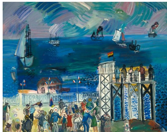
Fig. 4. Collection Privée [Fuaves] , Carlos Nadal. Óleo/lienzo, 73 x 92,5 cm. Colección particular.