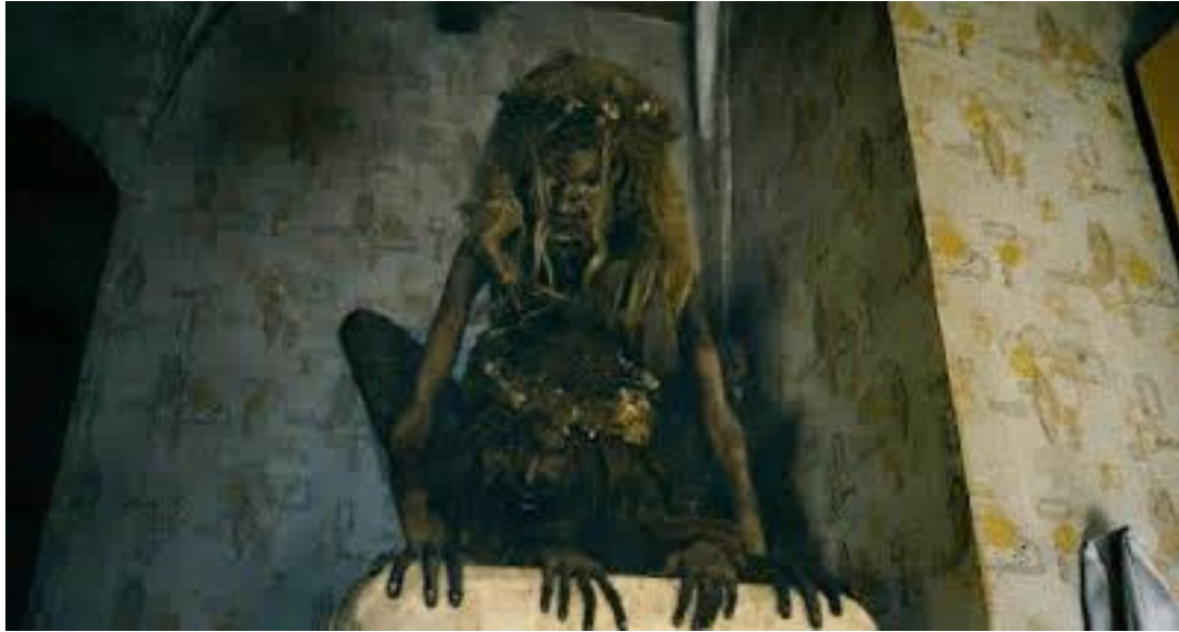
Imagen 1. Fotograma de la película Mamá ( Mama , Andrés Muschietti, 2013)

La figura del infante en estos filmes es un clásico a analizar, ya que puede combinar la inocencia con el engaño, la mentira de un ser que parece inofensivo y sin embargo puede ser el más terrorífico del planeta.