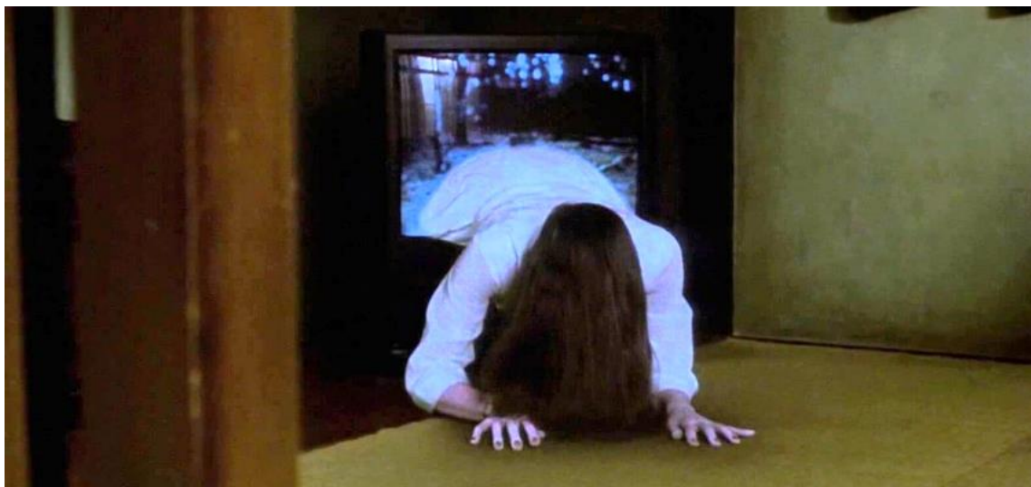
Imagen 9. Fotograma de la película The Ring (El círculo) ( Ringu , Hideo Nakata, 1998)

Creo que la fama de esta película en parte se debe a la actualización de la historia: casi todo el mundo tenía VHS en esa época y la simple idea de que rondara una cinta VHS maldita por todo el planeta atraía a la gente, ese morbo viral fue el que, personalmente pienso, le dio el “empujón” al filme. Aparece un personaje que pasa a ser parte del imaginario del género de terror internacional, el fantasma de la chica que sale de la televisión, Sadako.