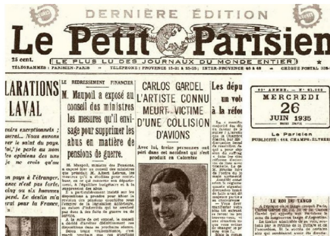
Le Petit Parisien, 26 de junio de 1935, 1

La radio logró lo que la prensa no había podido hacer y emitió de manera espontánea una noticia, lograron técnicamente montar la noticia (Cantor, 2016) y mediante este desafortunado evento, instaurar la figura del reportero en radio, un profesional que se dirigiera al lugar de los hechos y transmitiera desde allí los acontecimientos que estaba mirando. Esta noticia internacional marcaría un nuevo rumbo de información en adelante.