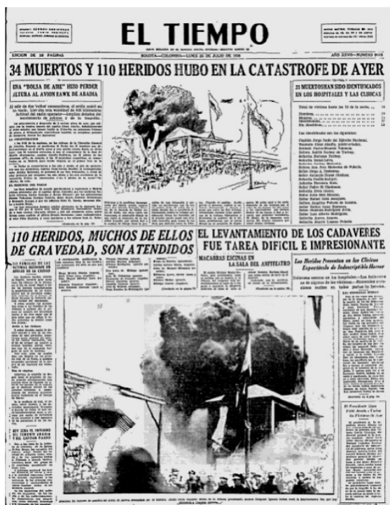
El Tiempo, 25 de julio de 1938, 1

involucraba una fuerte represión por parte del gobierno de López Pumarejo a todo síntoma de oposición (Castrillón, 2011a:123). Sumado a esto, en agosto de este año se celebraría el aniversario No. 400 de la fundación de Bogotá y se celebrarían los primeros juegos bolivarianos lo que da una nutrida agenda informativa en la que la radio vería su oportunidad de brillar con estos eventos: