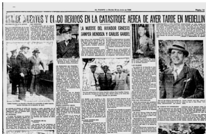
El Tiempo, 25 de junio de 1935, 11.