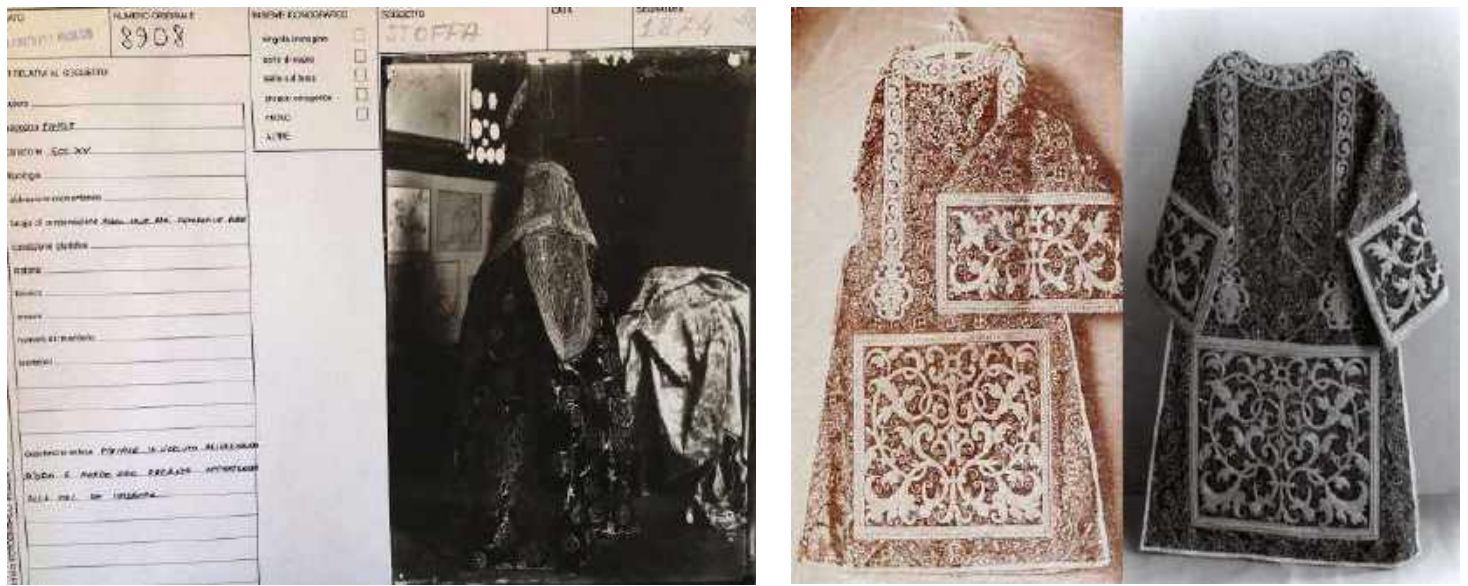
Fig. 3. Ficha de inventario de la fotografía de la capa pluvial realizada por Mariano Fortuny Madrazo y vendida por Raimundo Madrazo a Huntington en 1912. AMFV.