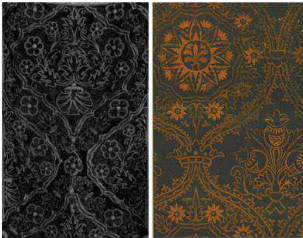
Fig. 5. Detalle del bordado de la dalmática de la colección de Mariano Fortuny Marsal, ca. 1873, AMFV. (Izquierda) / Diseño “Meneaux sinusoides” en, DUPONT-AUBERVILLE, Auguste. L’Ornement des Tissus. Paris, 1877. (Derecha).