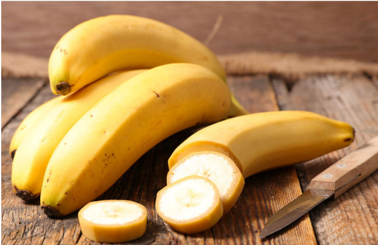
Banaan op hout