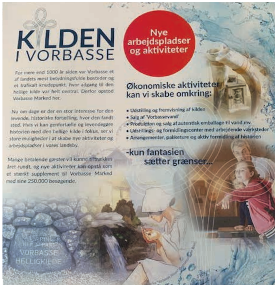
En husstandsomdelt flyer.