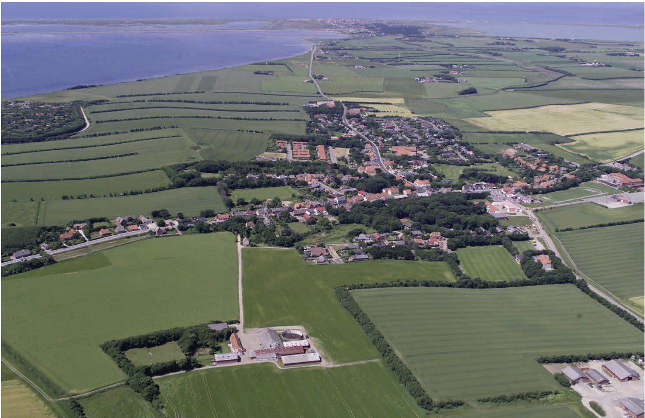
Vestervig fra oven. Foto: Knud E. Jensen

Kilder: www.livogland.dk og www.vestervig-by.dk