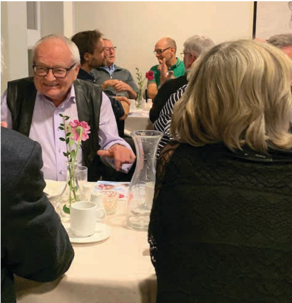
Engagerede landsbyfolk.

(fysiske ressourcer) og politisk (organisering) kapital, se f.eks. Healey m.fl. (2003).