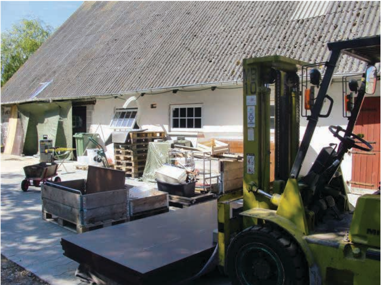
Ny virksomhed i nedlagt landbrugsbygning.

levevej på stedet, men det kan også være en helt ny, der i stedet drager fordel af et inspirerende miljø eller muligheden for et stedligt brand i forbindelse med markedsføring.