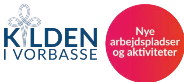
Logoet for Kilden i Vorbasse.

Efter nærmere drøftelser tog 'vandprojektet' en drejning forholdsvis hurtigt i forløbet. Fra at Vorbasse-vand skulle tappes og sendes til emballering andetsteds, distribueres og sættes på hylderne rundt om, skulle det være 'kunderne', der kom til Vorbasse. Vorbasse-vand skulle blive en del af et oplevelsesøkonomisk erhvervsprojekt, med kilden som spydspids for en levende genfortælling af Vorbasses enestående historie. Drejningen af perspektivet var stærkt inspireret af Læsø Sydesalt, der er et eksempel på betydningen af teoriernes påpegning af kultur og stedsidentitet som driver for fælles projekter 'nedefra'. Læsø Sydesalt er den levende genfortælling i skala 1:1 med adgang til saltsydning og salg af saltet i fokus, og med flere end 50.000 besøgende om året og efterhånden salg af salt alle steder: Det har skabt mange arbejdspladser, og bredt sig som ringe i vandet til f.eks. Læsø Kur og brandet Læsø.