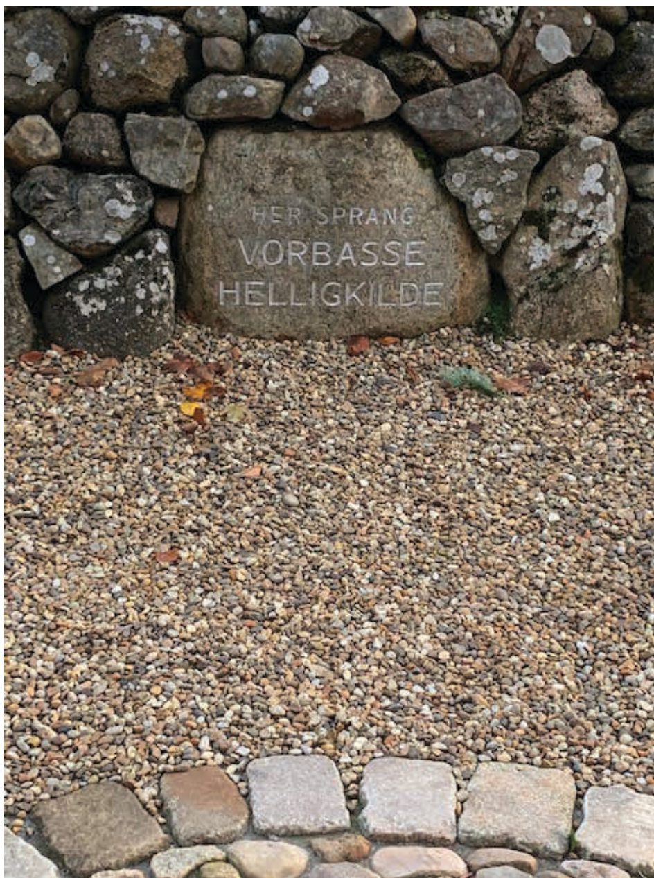
En unik stedlig ressource.