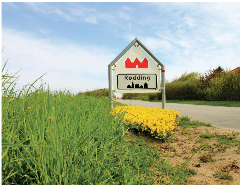
Rødning – æblets by i Salling bobler af aktiviteter. Foto: Hanne Tanvig

Kilder: www.rodningby.dk og www.youtube.com