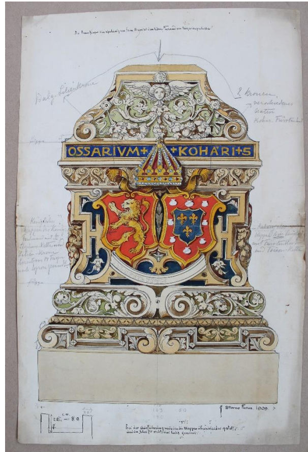
16. kép: A Koháry síremlék terve, 1908.