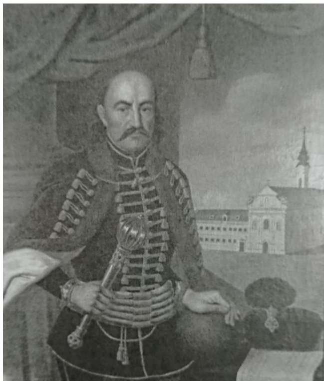
15. kép: Simonyi Antal olajfestménye Koháry Istvánról, Pest, 1850.

visszavételében szintén jelentős szerepet vállalt, és akit a császári budai helyőrség, magyar egységének parancsnokává neveztek ki.