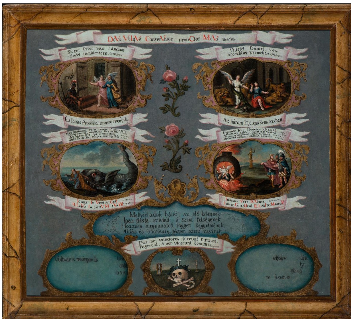
5. kép: Koháry István fogadalmi kép, 1726.

(A műtárgyról készült fénykép felhasználása a Szépműveszi Múzeum engedélye által; L.5.022.)