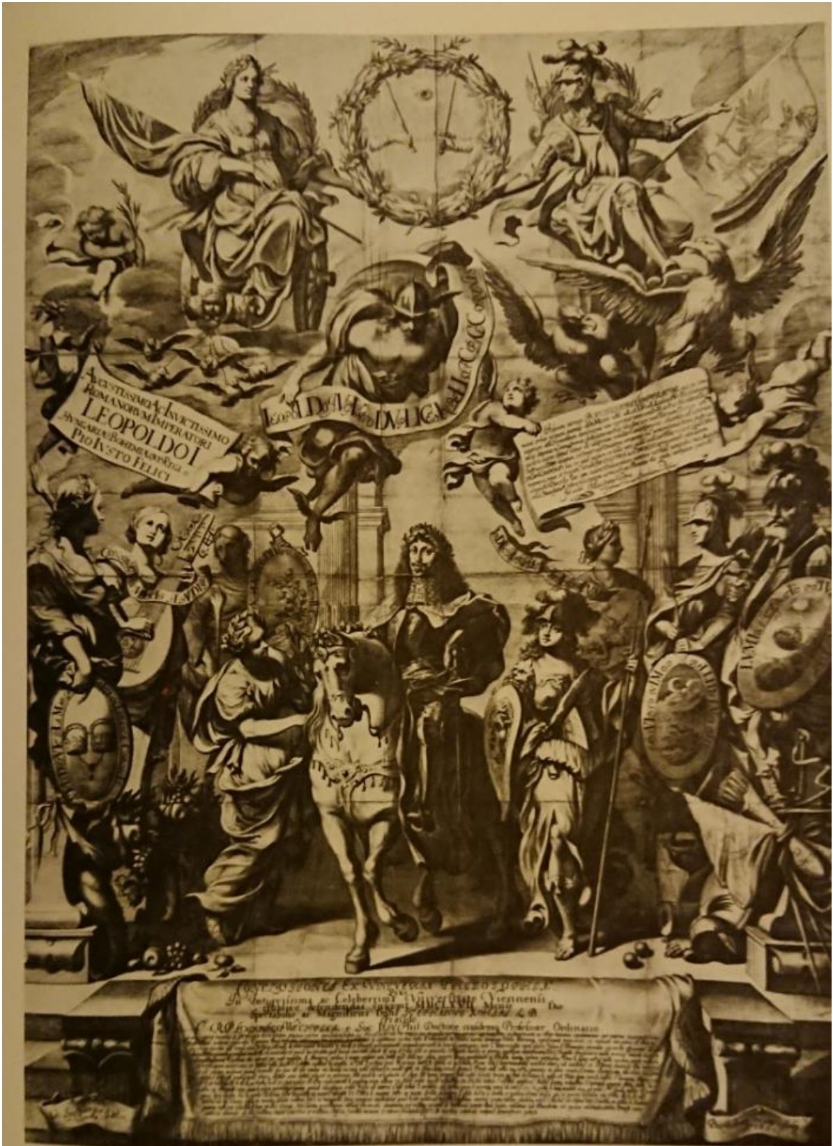
1. kép: Koháry István tézislapja, 1667.

(Közli: Galavics Géza: Kössünk kardot az pogány török ellen. Török háborúk és képzőművészet. Budapest, Képzőművészeti Kiadó, 71.kép) Eredeti lelőhely: Národní knihovna České republiky (A Cseh Köztársaság Nemzeti Könyvtára)