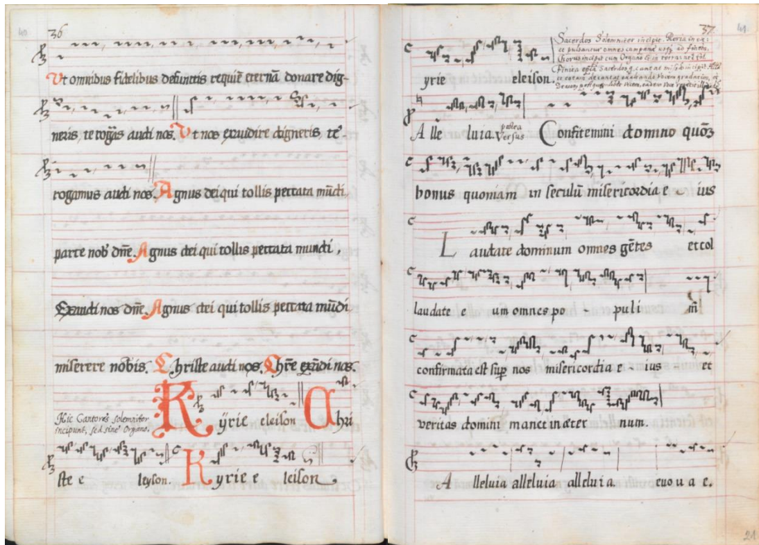
3. ábra. Kájoni és a tanítvány (?) keze „találkozik” a húsvéti vigília anyagában (ff. 20 v -21 r , Kpp. 36-37).