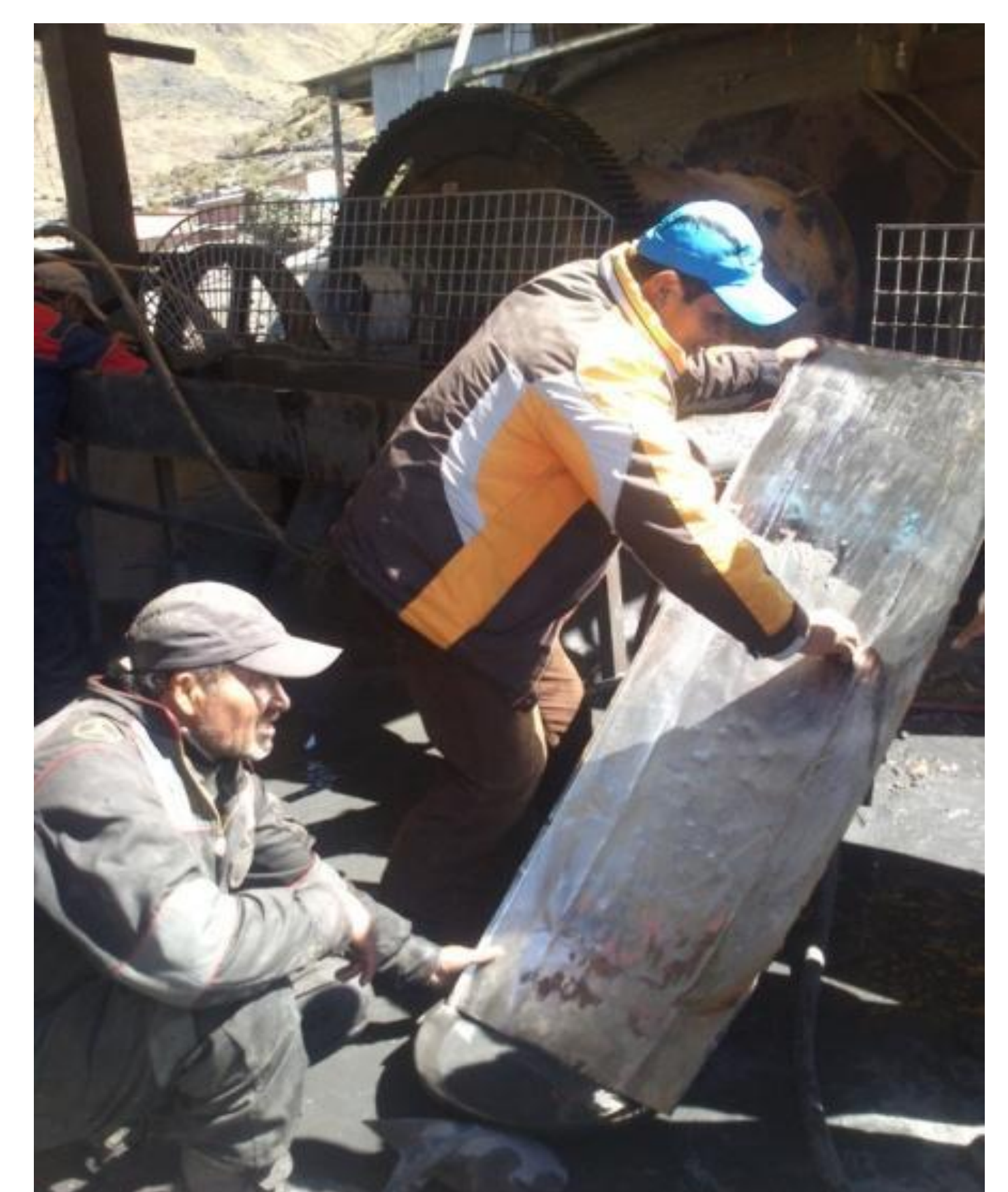
Extracció de l'amalgama (or + mercuri)