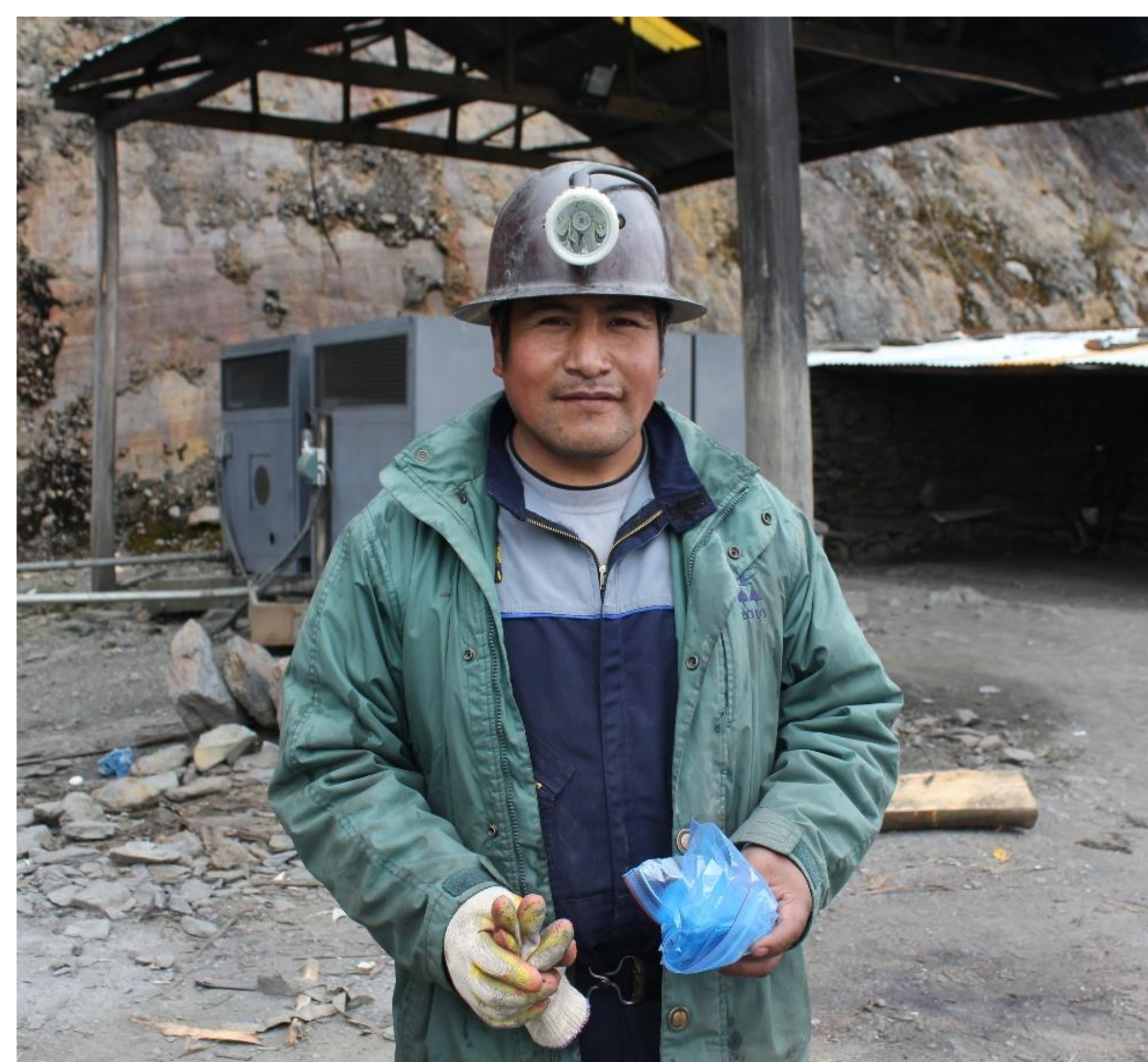
Cooperativista de la mina artesanal