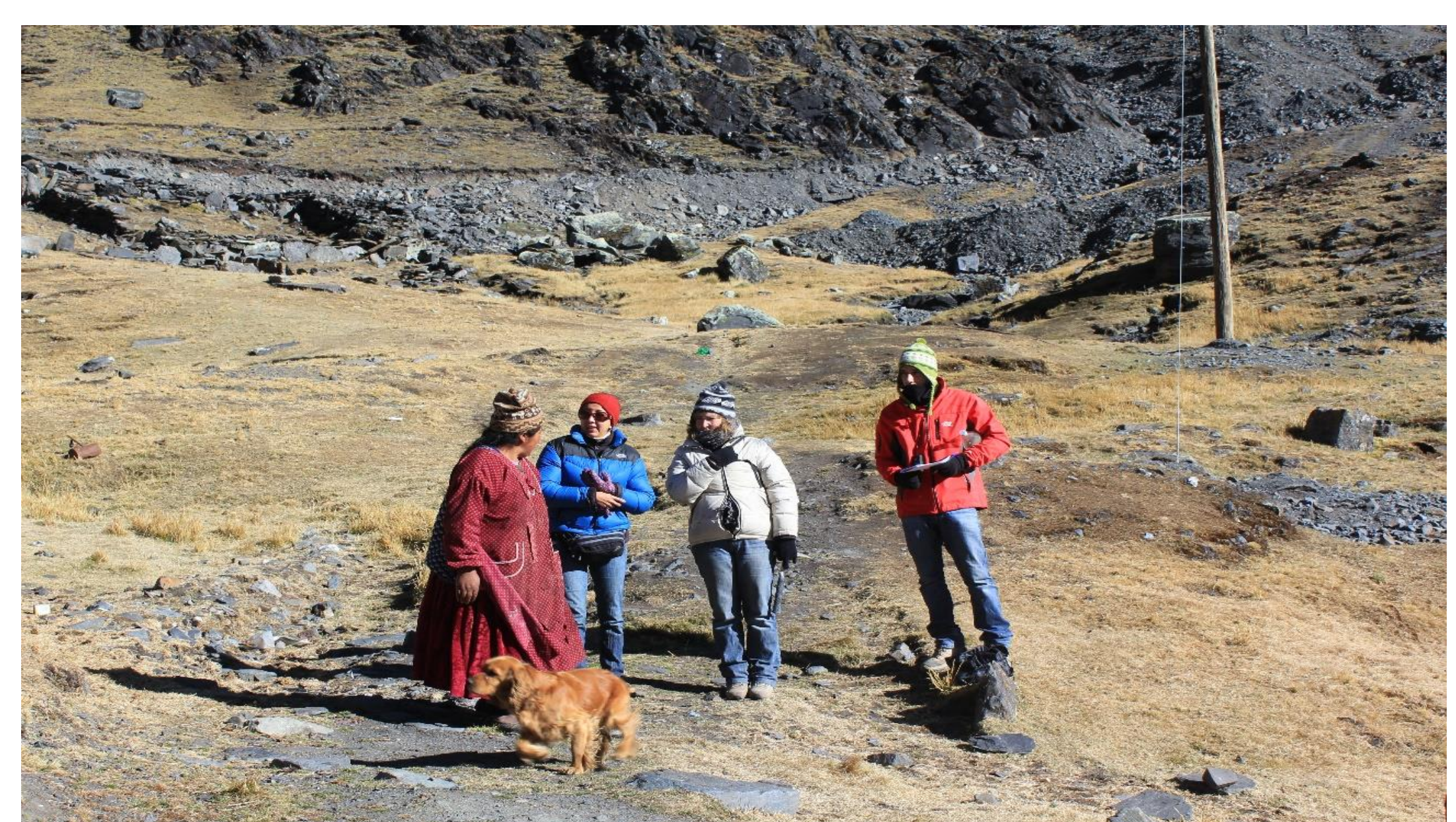
Nivell mig de la cultura preventiva en diversos tipus d'activitats mineres

Agraïments: L'organització Alliance for Responsible Mining (ARM) i les activitats mineres i entitats participants en els països on s'han realitzat les accions.