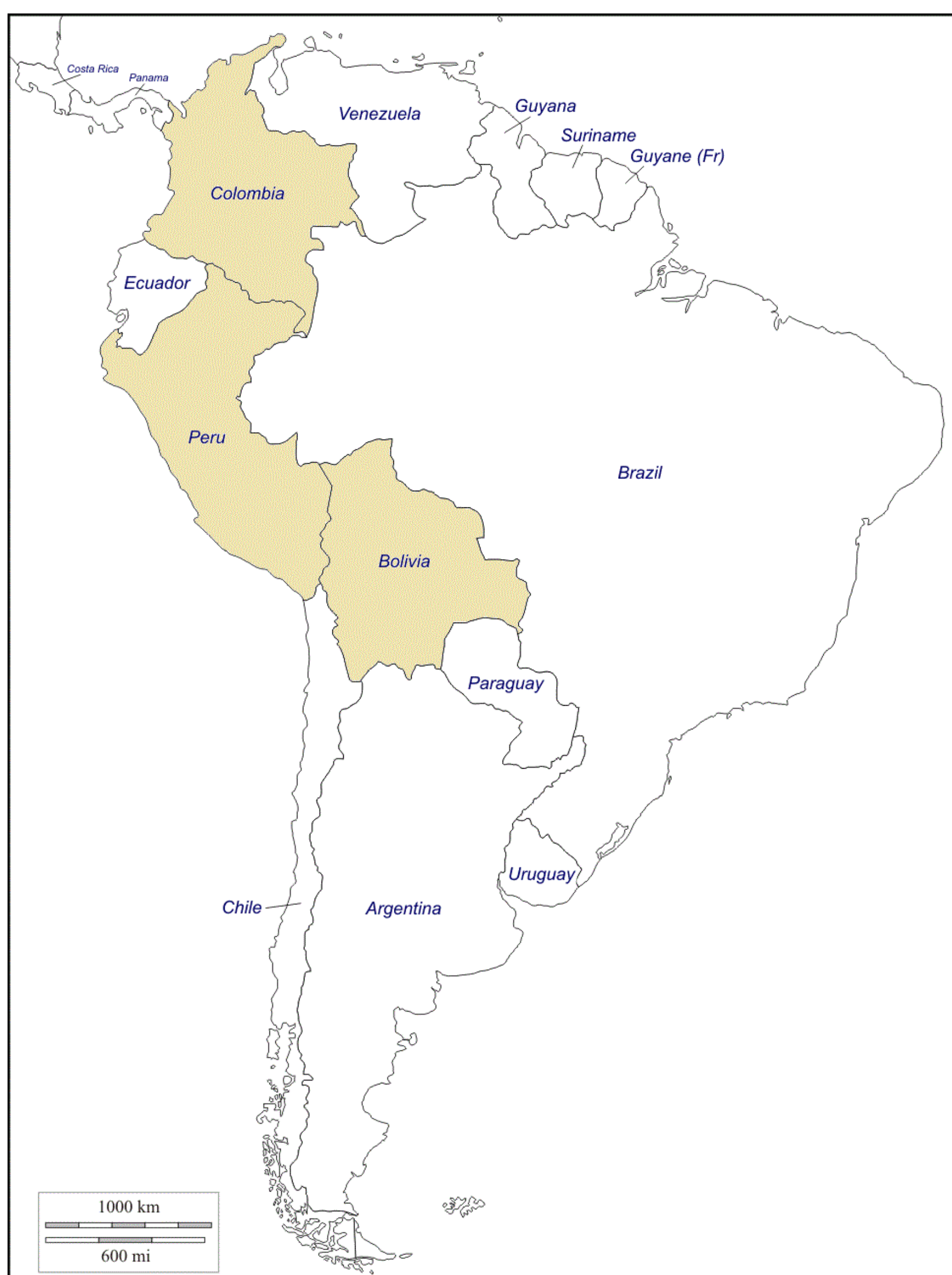
Països on s'han realitzat activitats dins dels processos de certificació Fairmined

S'han realitzat accions a diverses mines artesanals a Bolívia, Colòmbia i el Perú per tal d'aconseguir la certificació del comerç just de l'or Fairmined.