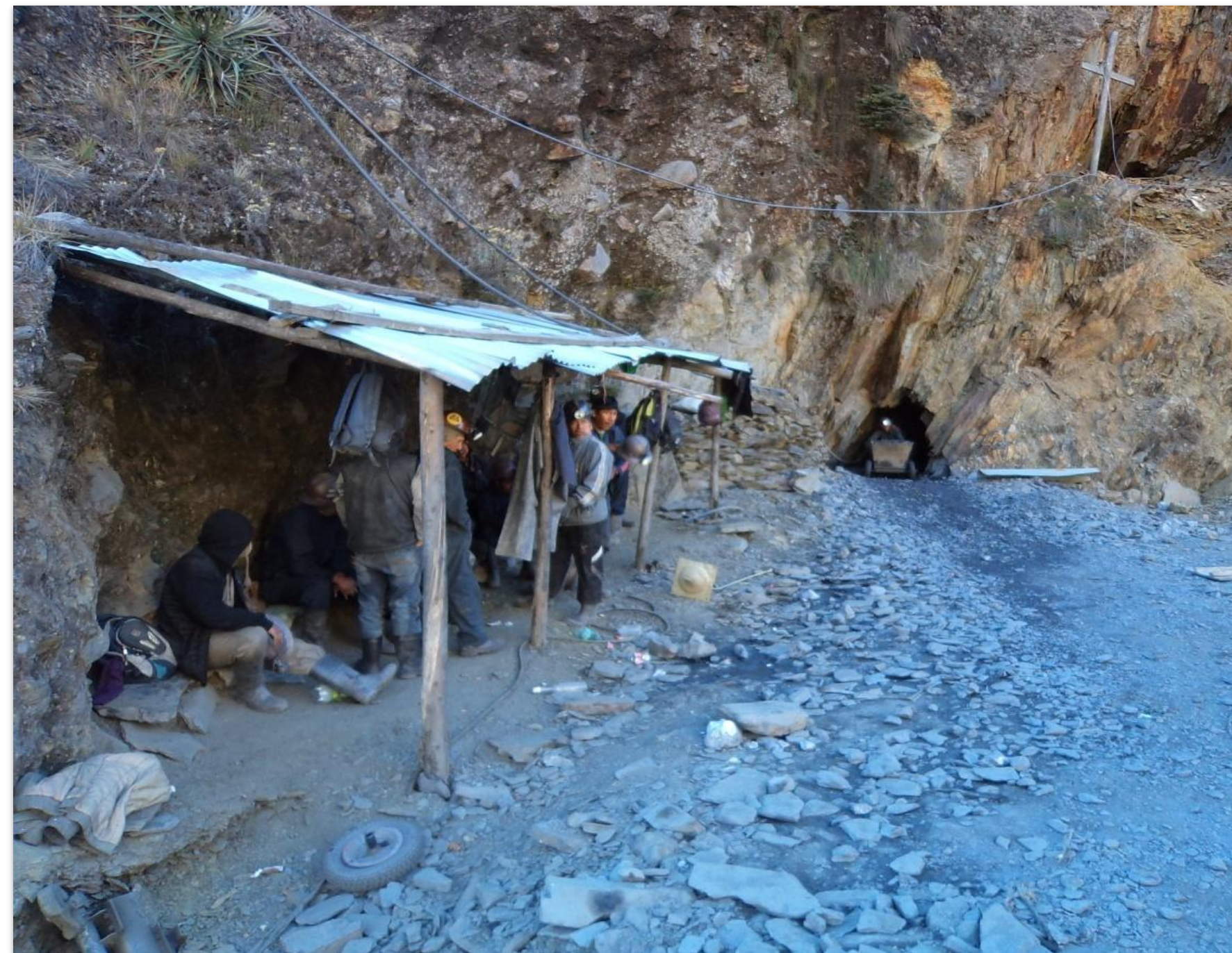
Entrada a la mina

Certificació de l'or extret de forma responsable per comunitats mineres artesanals, disposant d'una garantia de traçabilitat que permet conèixer l'origen exacte del mineral extret. Per aconseguir aquesta certificació es necessita complir un seguit de condicions en l'àmbit mediambiental, de seguretat en el treball i aspectes bàsics de l'organització de la cooperativa.