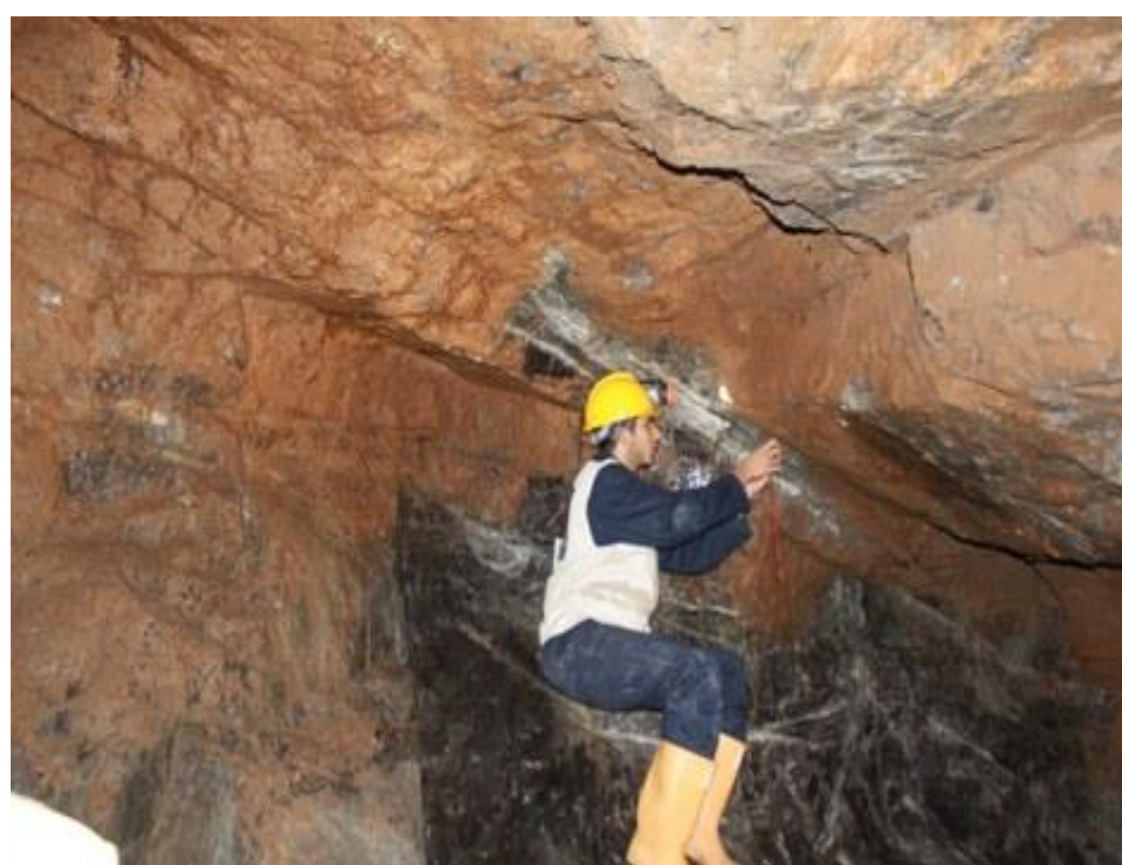
Mesura de les discontinuïtats dins de la mina