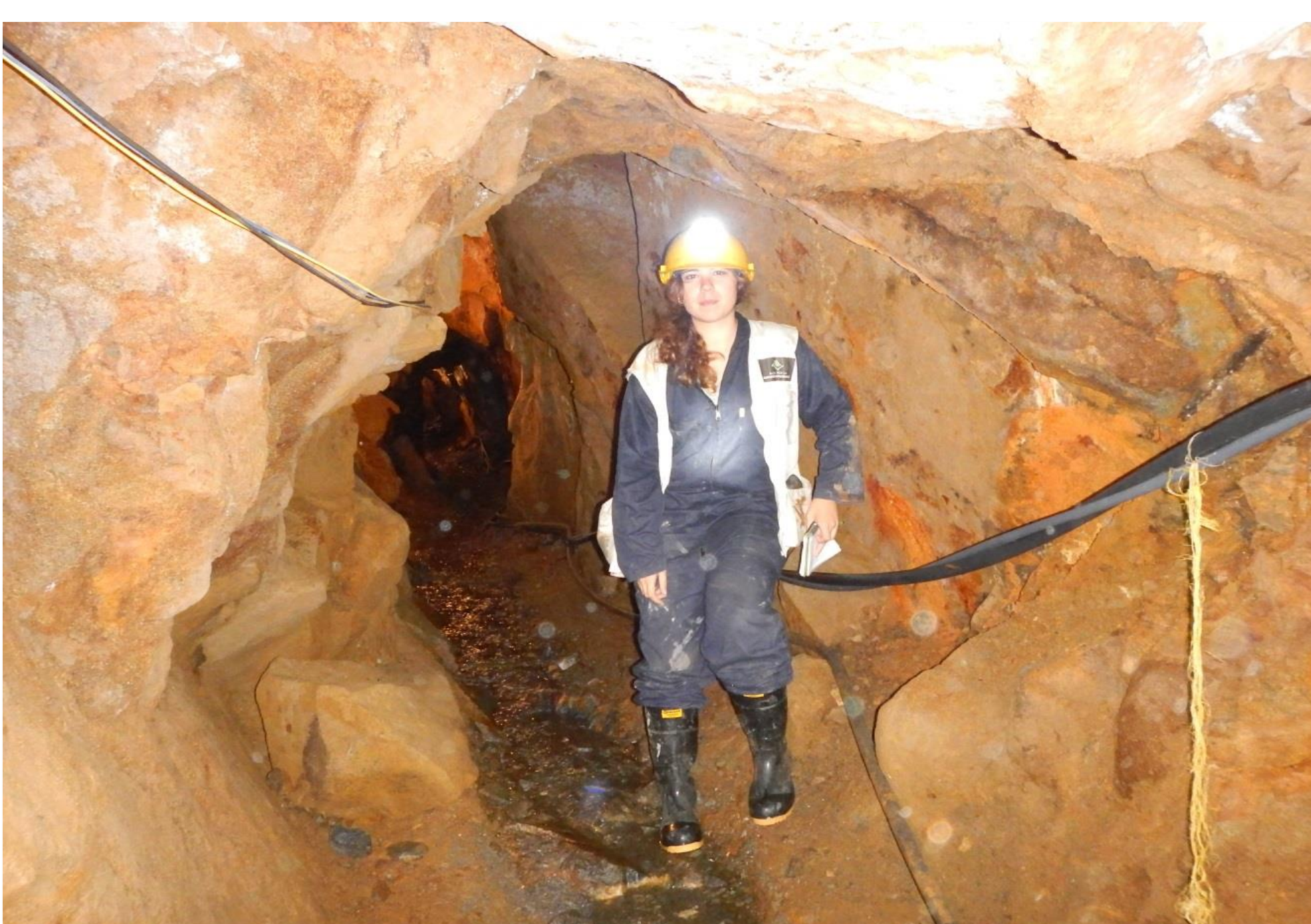
Cooperant a l'interior d'una galeria d'accés al front de treball