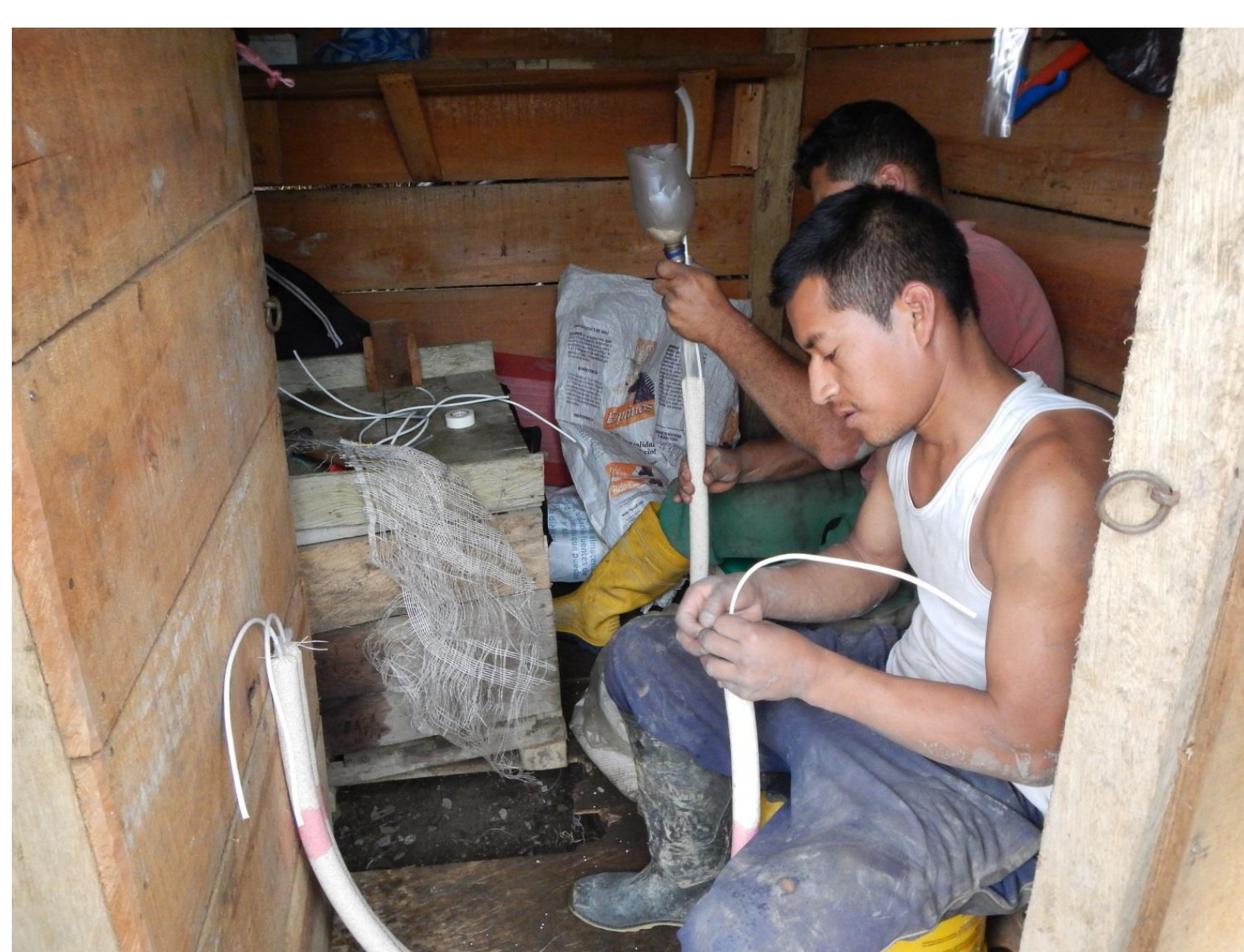
Preparació de l'explosiu