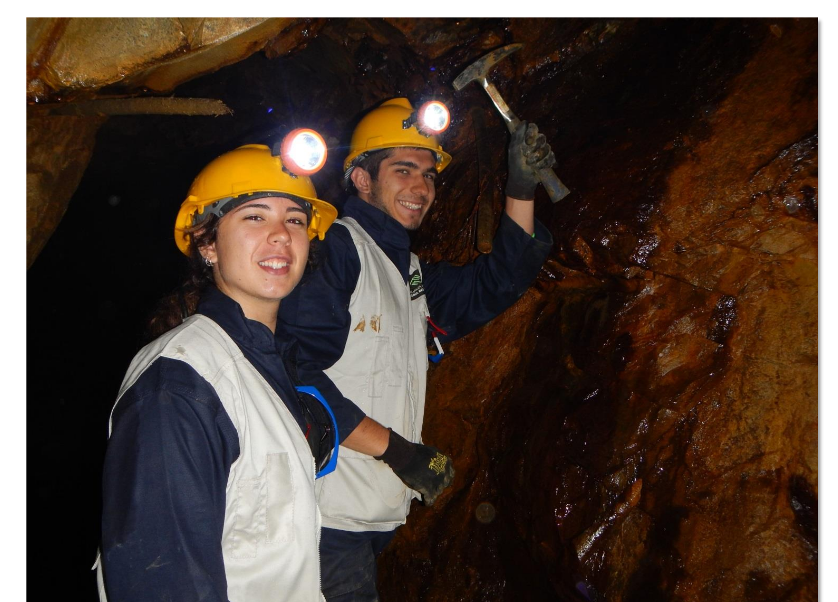
Extracció de mostres de mineral