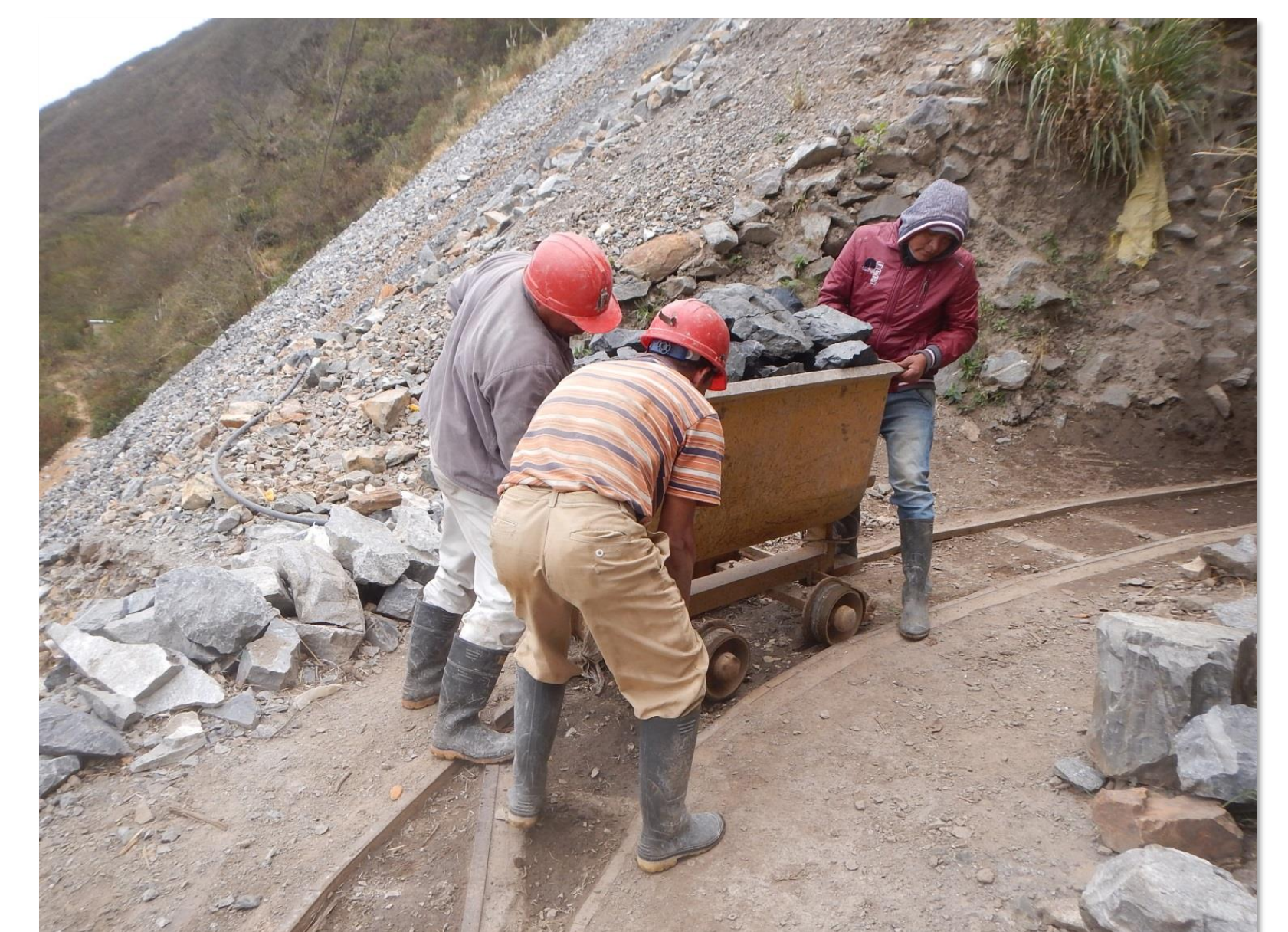
Miners extraient mineral de l'interior de la mina