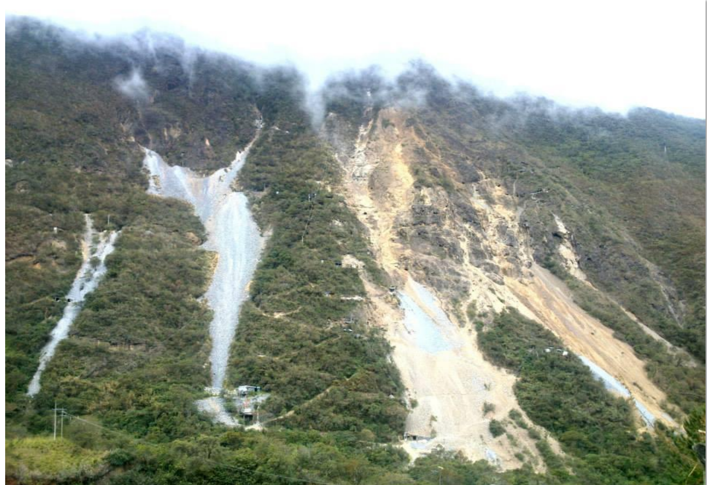
Vessant de la muntanya on es troben la majoria de mines