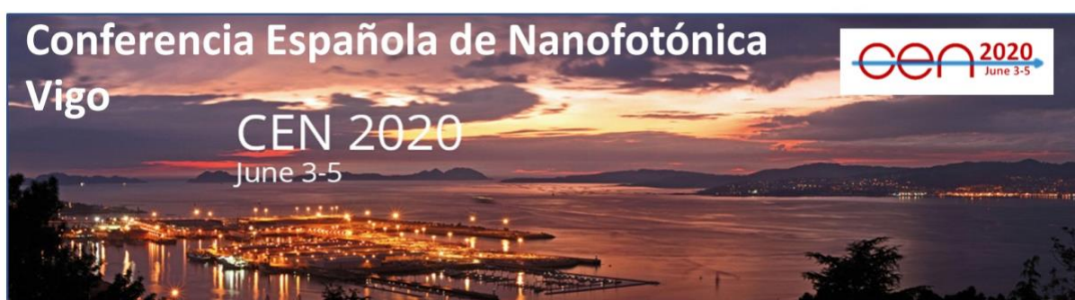
Conferencia Española de Nanofotónica CEN 2020 , Vigo 3-5 de junio de 2020