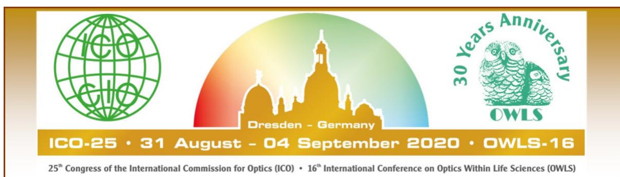
25th Congress of the International Commission for Optics – ICO25 , Dresden, Alemania, 31 agosto – 4 de septiembre de 2020