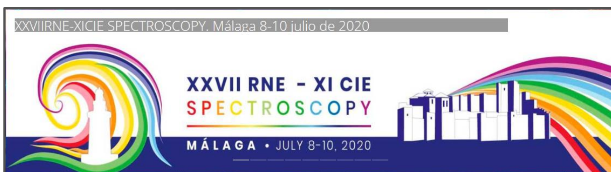
XXVII Reunión Nacional de Espectroscopia , Málaga, 8-10 de julio de 2020 Cuotas reducidas para los miembros de SEDOPTICA