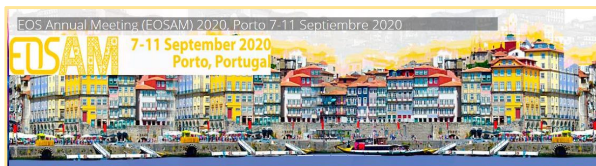
EOSAM – EOS Annual Meeting , European Optical Society, Porto, Portugal, 7-11 de septiembre de 2020 Cuotas reducidas para los miembros de SEDOPTICA, como sociedad afiliada a la EOS