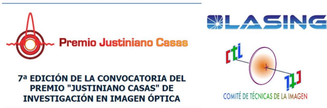
Fig. 8: Anuncio del Premio Justiniano Casas de Investigación en Imagen Óptica.

Aprovechamos esta sección también para anunciar por un lado la convocatoria de la séptima edición del Premio Justiniano Casas de Investigación en Imagen Óptica que promueve el Comité de Técnicas de Imagen , patrocinado por la empresa colaboradora LASING S.A. Podrán optar al premio los trabajos de tesis doctoral defendidos en 2017 y 2018 (en castellano, portugués o inglés) que cumplan los requisitos que figuran en las bases del premio, que pueden encontrarse en el siguiente enlace . El plazo de presentación de candidaturas está abierto hasta el día 20 de marzo de 2020.