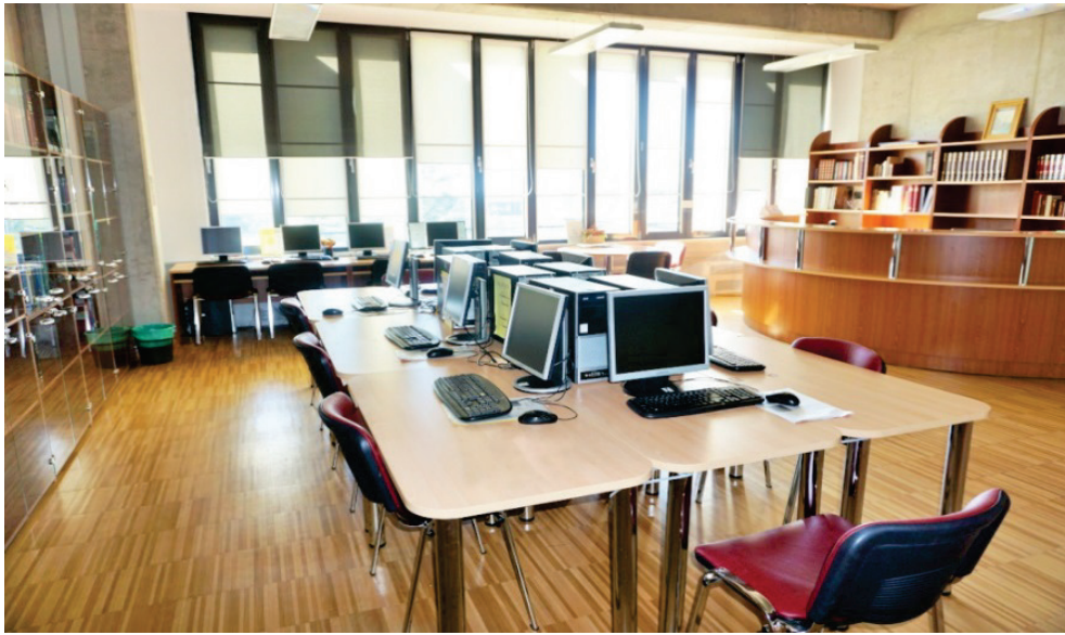
Slika 3. Prostor čitaonice

Edukacijski pristup korisniku primjenjuje se već od samog upisa, pri kojemu korisnik dobiva tiskani Informativni vodič i Edukaciju korisnika na CD-u. Uz to, Knjižnica organizira edukacijske radionice za studente prve godine svih studijskih grupa i ostale zainteresirane korisnike tijekom cijele akademske godine.