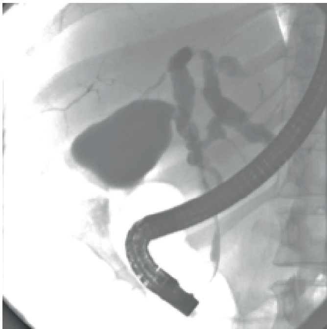
SLIKA 2. Endoskopska retrogradna kolangiografija (ERC) u bolesnika s primarnim sklerozirajućim kolangitisom (PSC)

Žučni vodovi u desnom jetrenom režnju su filiformni s mjestimičnim suženjima. Lijevi glavni žučni vod je proširen uz dilataciju jednoga žučnog voda u lijevom režnju sa suptotalnom stenozom. Glavni žučni vod je gracilan s nekoliko suženja. Nalaz odgovara promjenama u sklopu primarnog sklerozirajućeg kolangitisa (PSC).