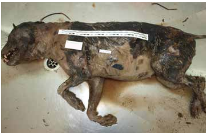
Slika 5. Lešina psa kod koje se jasno uočavaju uznapredovali znakovi truljenja poput stvaranja truležnih plinova (izbočena trbušna stijenka), prljavo zelenkasta prebojena mjesta na koži trbuha (pseudomelanoza) te autolitično-truležni procesi razgradnje koje obilježava krpičasto raspadanje tkiva (dlaka i koža su vlažne i dlaka se lako skida prstima s kože, dok se na mekušima i njuški epidermis spontano odvaja od dermisa).