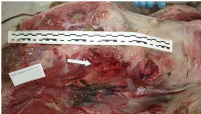
Slika 4. Potkožje desne strane trupa lešine. Bijelom strelicom označeno je mjesto krvnog podljeva površine 12 x 6 cm.

ve i prsnoga koša jedino su vidljive na lešini te one zasigurno nisu mogle nastati tijekom borbe s drugim psom, koja bi rezultirala smrtnim ishodom jedinke. Razumije se kako ne možemo tvrditi da životinja nije sudjelovala u borbama, bez obzira na to što nismo našli specifične ozljede koje se obično uočavaju u psa korištenog u navedene svrhe. Naime, dobro je poznato da se kod takvih pasa uobičajeno nalaze ozljede u obliku rana, a poslije i ožiljaka na koži, kao posljedica cijeljenja rane, katkad i prijeloma različite sta-