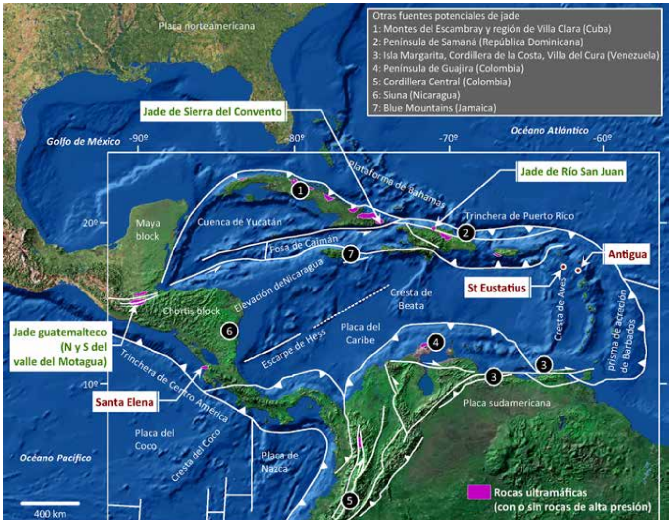
Figura 1: Localización de depósitos de jadeíta la región del Caribe, de objetos arqueológicos de jade estudiados en Antigua (Harlow, Murphy, Hozjan, de Mille y Levinson, 2006) y St. Eustatius (García-Casco et al., 2013), de cuerpos ultramáficos (incluyendo Santa Elena en Costa Rica) y de otras potenciales fuentes de jade relacionadas con rocas ultramáficas de alta presión. Nótese que los complejos de Santa Elena (y Nicoya) no son fuentes potenciales de jade, ya que no muestran rocas metamórficas de alta presión, aunque podrían albergar depósitos de nefrita. Modificado de García-Casco et al. (2013) y traducido por los autores de esta publicación.

(no necesariamente jade) o incluso de otros colores (Bishop, Sayre y Mishare, 1993; Lange y Bishop, 1983; Lange et al., 1993). Los jades sociales en Costa Rica poseen un rango de utilización arqueológico que se extiende del 500 a. C. al 800 d. C. (Fernández y Alvarado, 2006; Snarskis, 2003). Aunque las piezas de jade social son numérica y volumétricamente subordinadas con respecto al resto de piezas de material lítico arqueológico, tanto en los hallazgos o sitios arqueológicos, no lo son con respecto al número de muestras