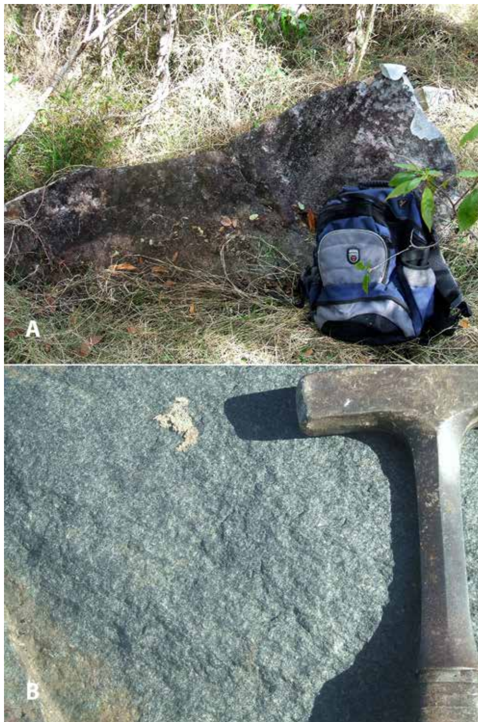
Figura 2: A) Ejemplo de un afloramiento de jade jadeítico en el mélangé de la sierra El Convento, en el oriente de Cuba, y B) detalle de la roca (jadeitita).