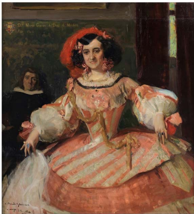
Joaquín Sorolla, «La actriz doña María Guerrero como "la dama boba"» (1906). Óleo sobre lienzo. Museo del Prado.