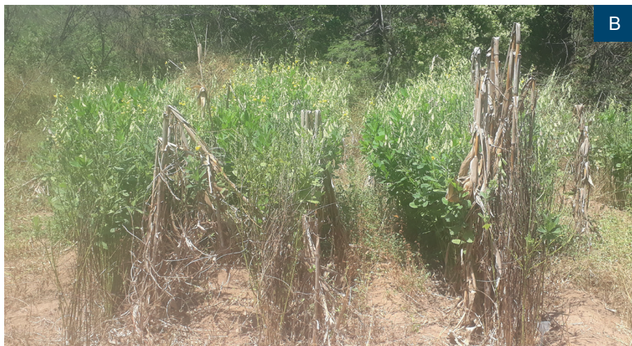
Figura 2. Colheita do material aos 115 dias após o plantio da cultura anual (A e B).