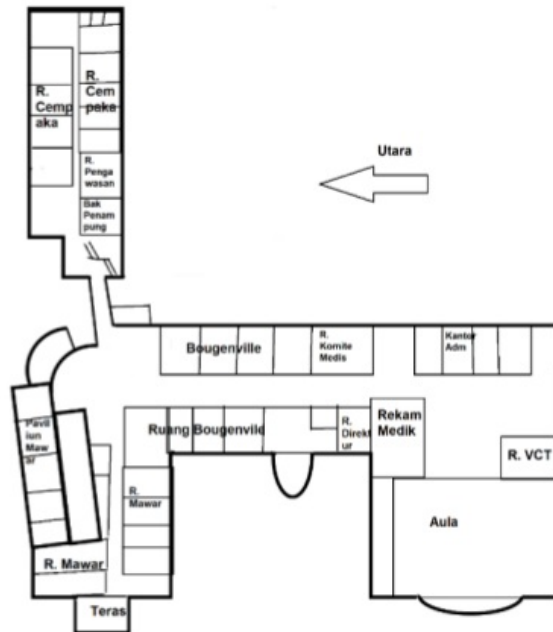
Gambar 2. Denah RSUD Ungaran Lantai 2