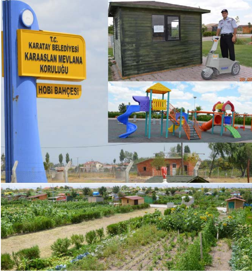
Fot. 5- Mevlana hobi bahçesinde sosyal donatılar ve bahçelerin genel görünümü

Karatay Belediyesi, 2011 yılında Karaaslan Mevlâna Koruluđu'nun (452.000 m 2 lik) yanında yer alan 166.000 m 2 .lik alanda Mevlana hobi bahçesini oluşturmuştur (Fot. 5). Karatay belediyesi tarafından ilçe sınırlarında yaşayan vatandaşlarının hizmetine sunulan Karaaslan Mevlana Hobi Bahçeleri 200'er m 2 .lik 252 parselden oluşmaktadır. Karaaslan Mevlana Hobi Bahçeleri için 305 kişi müracaat etmiştir. Başvuru sayısının parsel sayısından fazla olması nedeniyle de Noter huzurunda çekilen kura sistemiyle hobi bahçelerinin sahipleri belirlenmiştir. Hobi bahçesi sahipleri belirlenen sürede içinde yıllık 200 TL yıllık kullanım aidatını yatırdıktan sonra park bahçeler müdürlüğünde hobi bahçesi tahsis ve kullanım protokolünü imzalayarak parsellerini teslim almışlardır.