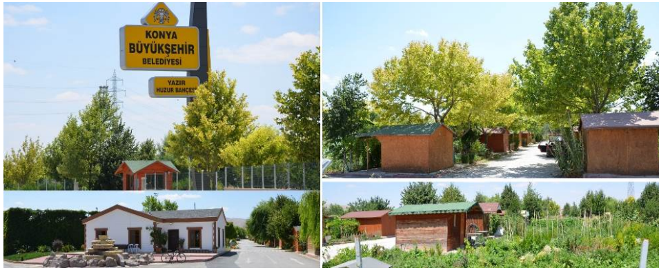
Fot. 2- Yazır hobi bahçesinde sosyal donatılar ve farklı bahçe örneklerinden görünüm

WC, 60 çöp konteyneri, fitness alanı, iki mescit, çocuk oyun alanı, süs havuzu ve her biri yaklaşık 150 m 2 .lik 1.104 adet parsel vardır (Fot.2). Yazır hobi bahçelerinde sebze yetiştirenlere yardımcı olmak amacıyla ziraat mühendisi ve kimyagerler danışmanlık yapmaktadırlar. Hobi bahçesi içerisinde 4.327 adet büyük ağaç, 20 adet süs bitkisi, su şebekesi, aydınlatma sistemi, ahşap kulübeler ve sesli anons sistemi bulunmaktadır (Büyükşehir Belediyesi, Park ve Bahçeler Müdürlüğü, 2015). Bahçeler içerisinde sebze, meyve yetiştiriciliği vb. tarımsal faaliyetlerde sadece organik tarım metotlarına uygun üretim yapılmaktadır.