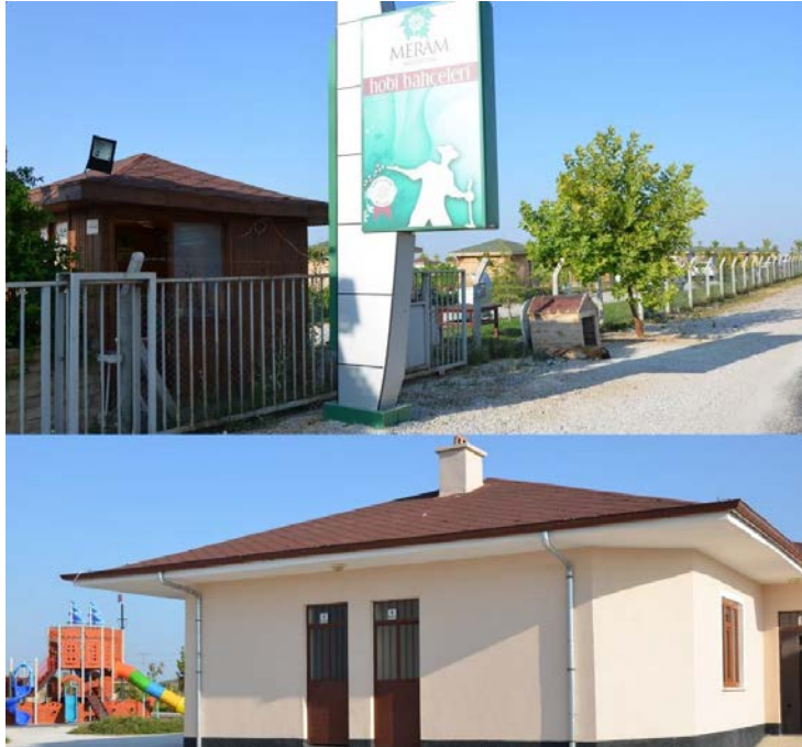
Fot. 6- Meram hobi bahçesinde sosyal donatıların görüntüsü

Meram Belediyesi tarafından 2011 yılında Karahüyük Mahallesi'ndeki yaklaşık 91 bin m 2 .lik alanda hobi bahçesi inşa etmiştir. Her biri 200 m 2 .lik olmak üzere toplam 320 hobi bahçesi ve tüm kamelyalar da belediye tarafından inşa edilmiştir (Fot.6). Hobi bahçelerinin dış kenarı tel duvar ile parsellerin kenarları ise mazı bitkisi ile çevrilidir. Hobi bahçelerinin içindeki yol ve sokaklara çiçek ve ağaç isimleri verilmiştir. Her parselde bir ıhlamur ağacı belediye tarafından dikilmiştir. Ayrıca hobi bahçesinin kenarında bulunan tarihi Demirlihan da restore edilerek ziyarete açılmıştır. Nisan 2011'de noter huzurunda çekilen kura ile hak sahipleri belirlendi. Meram Hobi bahçesinde yer alan parsellerin yüzde 10'luk bir kısmı engelli vatandaşlara ayrılmıştır. Parsel sahiplerinden su parası alınmamakta ancak yıllık 400 lira kira alınıyor.