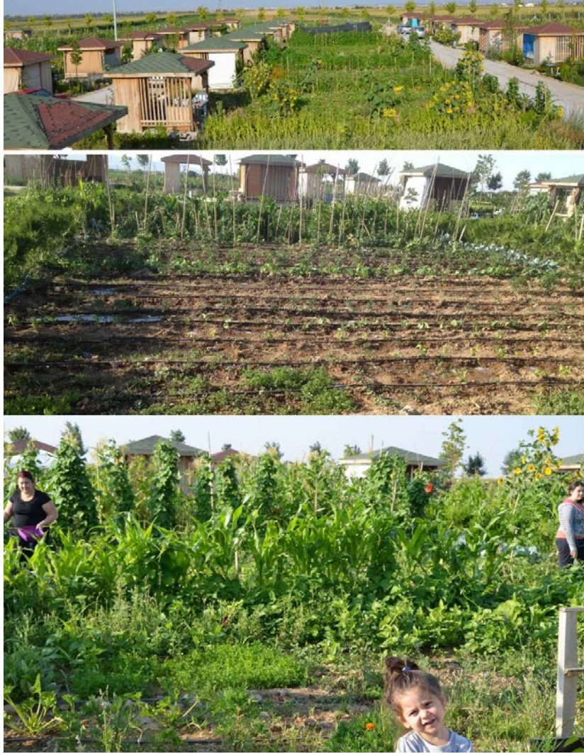
Fot.7- Meram hobi bahçesinin genel görünümü ve bir hobi bahçesinde ürünlerin dikim aşaması ile hasat aşamasından bir görüntü

Meram belediyesi hobi bahçelerinde 6 yıllık bir kullanım sonrasında 2017 yılı itibariyle bütün parsel kullanıcılarının sözleşmelerini iptal ederek, yeniden tahsis işlemine başlamıştır. Bu nedenle Nisan ve Mayıs aylarında kullanıcılarına başvuru için ilana çıkmış ve yaklaşık 900 kişilik bir başvuru ile noter huzurunda yeni kullanıcılara 5 yıllığına tahsis etmiştir. Belediye hobi bahçesi alanında bütün eski kamelyalar yıkılarak yerleri düzenlenmiştir. Yeni parsel sahipleri tarafından belediyenin belirlediği büyüklük ve planda kamelyaların