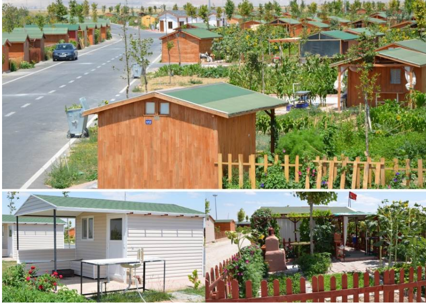
Fot. 4- Kayacık hobi bahçesinde bulunan çeşitli bahçe ve yaşam alanlarından görünüm

Hobi bahçesini kiralayan vatandaşlar organik tarım ile istedikleri ürünleri ekip dikmektedir. 150 m 2 her parselde su sayacı da mevcuttur. Hobi bahçelerine belediye tarafından yeşil alanlar, asfalt ve taş döşemeli sokaklar, her parselde 2 tane olmak üzere toplam 1140 ağaç dikilmiştir. Ayrıca yol kenarlarında da toplam 153 ağaç bulunmaktadır (Fot. 4).