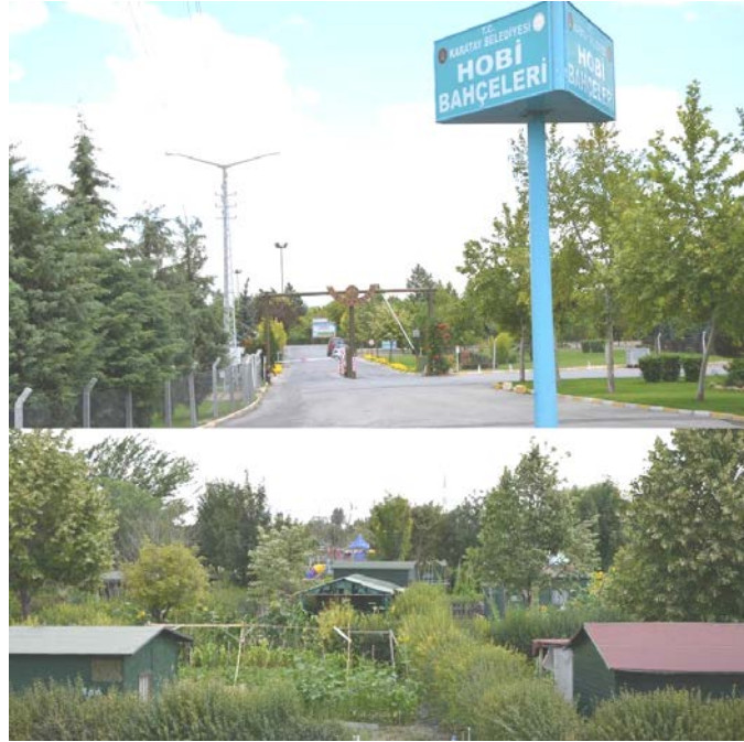
Fot. 1- Karatay hobi bahçesinin farklı noktaların görünümü

Konya'da ilk kez Karatay Belediyesi tarafından halkın, kentin stresinden, bunaltıcı havasından kurtulmak, sebze ve meyvesini kendisi yetiştirmek isteyen ilçe sınırları içinde yaşayan vatandaşlar için 2002 yılında Konya-Ereğli çevre yolunda her biri 200 metrekare olan 823 adet hobi bahçesi oluşturmuştur (Fot.1). Karatay belediyesi hobi bahçesini 3 yıllığına tahsis ettiği kişilerden yıllık 90 lira kullanım bedeli almaktadır. Ancak, her bahçe sahibinin; belli standartlarda ahşap kulübe inşa ettirmesi zorunludur.