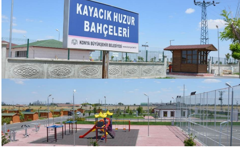
Fot. 3- Kayacık hobi bahçesinde sosyal donatılar ve idari binadan görünüm

Hobi bahçesini kiralayan vatandaşlar organik tarım ile istedikleri ürünleri ekip dikmektedir. 150 m 2 her parselde su sayacı da mevcuttur. Hobi bahçelerine belediye tarafından yeşil alanlar, asfalt ve taş döşemeli sokaklar, her parselde 2 tane olmak üzere toplam 1140 ağaç dikilmiştir. Ayrıca yol kenarlarında da toplam 153 ağaç bulunmaktadır (Fot. 4).