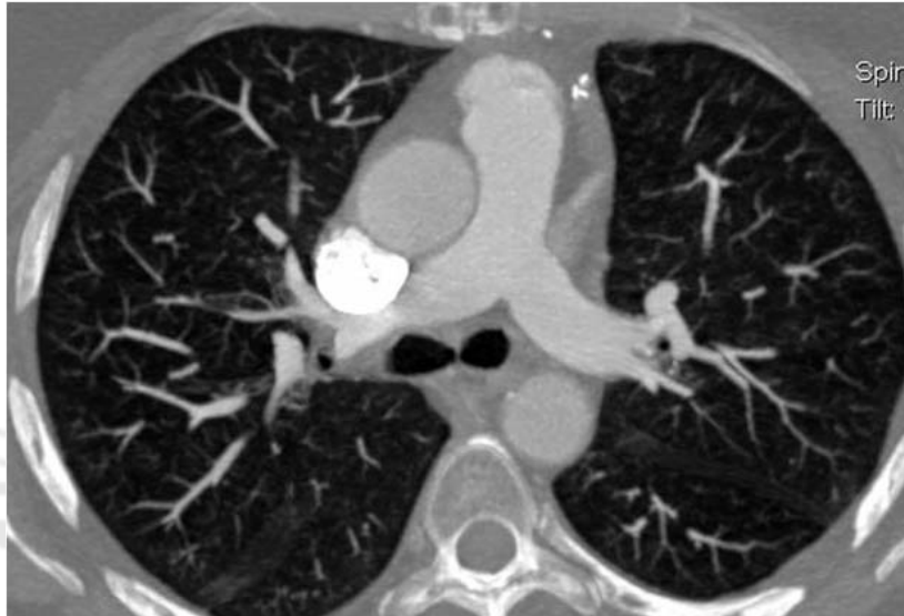
Figura 3. Angiografía torácica por tomografía computarizada realizada a los 6 meses de evolución.