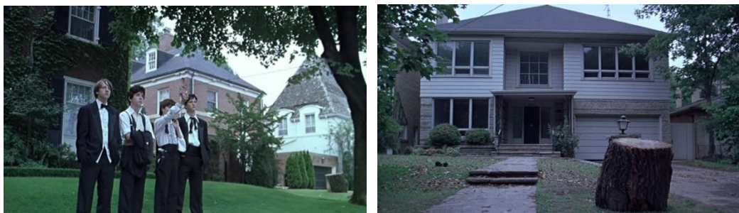
Figura 8 – Última cena do filme The Virgin Suicides (1999). Os meninos observam a casa das irmãs Lisbon e a árvore tolhida.

Por isso os episódios de crescimento são tão importantes para Sofia Coppola, e se dão sem estardalhaços. Mesmo que quatro meninas se suicidem, como em The Virgin Suicides , essa morte é catalisadora. No que McKee (2006) falou sobre as cargas de valor que vem com o clímax, negativas ou positivas, as cargas negativas das meninas provocam o que podem ser as cargas positivas dos meninos que as espiavam, a dor, o susto e o rompimento necessários para crescer (Fig. 8). Os meninos são os que ficam e tem de viver com as mudanças provocadas pela nova percepção da realidade. É o que, para Campbell (2007), configura o momento de passagem que, quando completo, equivale a uma morte seguida de nascimento (p. 61).