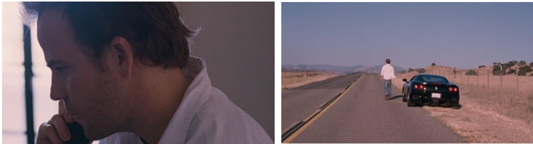
Figura 10 – Sequência final do filme Somewhere (2010). Jonny Marco fecha a conta do Chateau Marmont e abandona o carro no acostamento com a chave ingnição e segue seu caminho a pé.