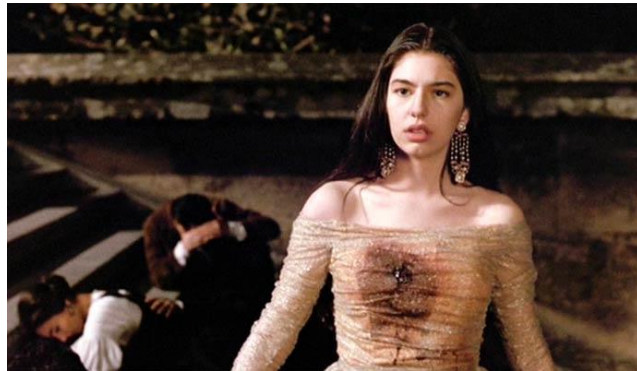
Figura 3 – Cena de The Godfather III (1990). Sofia Coppola, 17 anos. Fonte: The Godfather III , 1990.

Mal sabia que, em 1998, voltaria ao cinema. Agora por trás das câmeras. Com o incentivo do pai, rodou o primeiro curta-metragem, Lick the Star (1998) (Fig. 4), em uma escola para meninas nos Estados Unidos: “Eu simplesmente amei o resultado, e isso meio que me ajudou a encontrar meu caminho” (O’HAGAN, 2006). Lick the star já trazia o germén do projeto poético de Sofia Coppola, ao colocar personagens em um contexto de crescimento provocado por rompimentos.