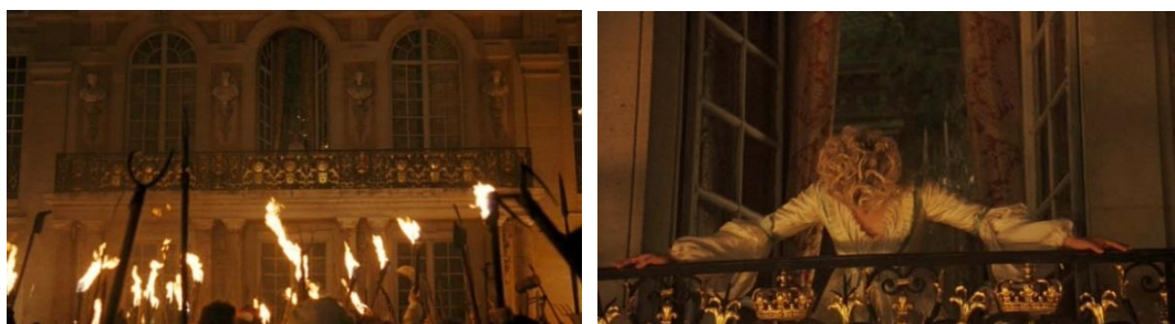
Figura 9 – Cena do filme Marie Antoinette (2006). Maria Antonieta diante da multidão na varanda do palácio. Fonte: Marie Antoinette , 2006.

A história que eu queria contar começa com a chegada dela em Versalhes e termina com sua fuga de lá. Meu desejo era acompanhá-la desde a juventude até virar uma mulher, para que o público pudesse ver sua transformação e sua jornada através dos obstáculos com os quais se depara. E como ela finalmente surge como uma rainha na varanda do palácio. (...) Quando me contaram a história da varanda de Versalhes, soube que foi nesse momento que ela se tornou rainha. (COPPOLA apud NEILSTEIN, 2007).