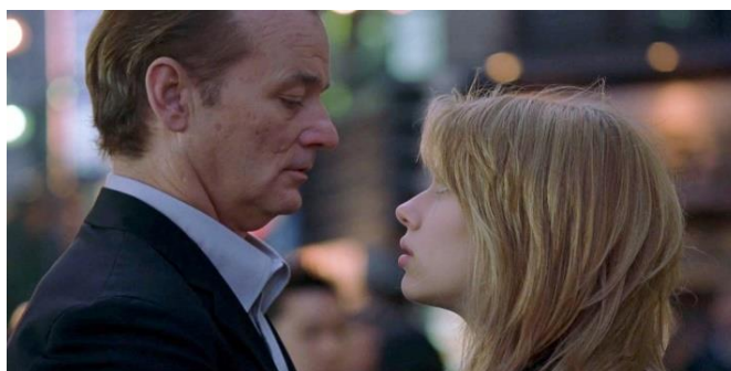
Figura 7 – Cena do filme Lost in Translation (2003). Despedida de Bob e Charlotte. Fonte: Lost in Translation , 2003.

Em todos os filmes de Sofia, até aqui, o clímax tem-se voltado para uma ideia de crescimento, de autopercepção, para bem ou para mal. O suicídio das irmãs Lisbons em The Virgin Suicides (1999); a despedida de Bob e Charlotte em Lost in Translation (2003) (Fig. 7); a invasão do palácio em Marie Antoinette (2006); o fim das férias da filha em Somewhere (2010); a descoberta dos roubos e a separação do grupo em The Bling Ring (2013).