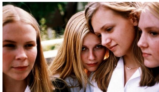
Figura 4 – Still de Lick the Star (1998), do primeiro curta-metragem de Sofia Coppola. Figura 5 – Still de The Virgin Suicides (1999), primeiro longa-metragem de Sofia Coppola.