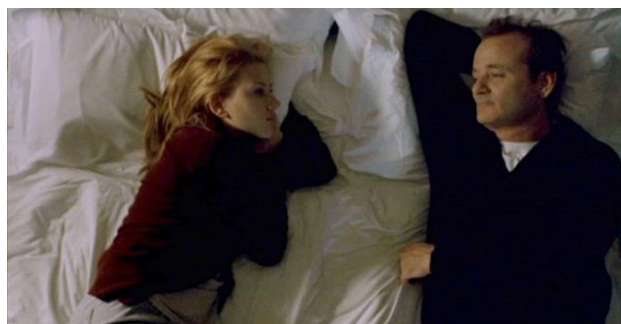
Figura 6 – Cena de Lost in Translation (2003). Bob e Charlotte conversam sobre tentar encontrar o próprio caminho.

BOB: Isso já é bom. ( Lost in Translation , 2003, 1h11min).