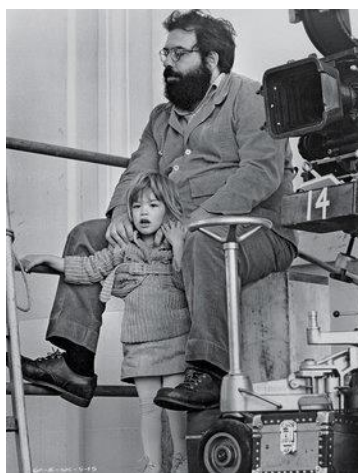
Figura 1 – Cena de The Godfather I (1972). Sofia Coppola, bebê. Figura 2 – Fotografia tirada no set de filmagem de The Godfather II (1974). Sofia Coppola, 3 anos, no colo do pai durante as filmagens.

Com 17 anos, depois de uma atuação muito criticada em The Godfather III (1990) (Fig. 3), Sofia decidiu sair da frente das câmeras e procurar outro caminho. Sobre esse episódio, contou a O'Hagan (2006): “Eu realmente não penso nisso como um grande erro, era mais uma forma de descobrir o que eu não queria fazer”. Decidiu estudar artes plásticas e entrou para o Califórnia Institute of Art. Nessa época, além de pintura, nutria interesse por moda e fotografia, chegando a desenhar sua própria marca de roupas, Milk Fed, que ainda existe como uma franquia lucrativa no Japão. Em entrevista a MTV, em 1995, foi apresentada como “designer”, com então 22 anos (HOUSE OF STYLE, 1995). “Eu era meio perdida e sem foco”, comentou a O'Hagan (2006).