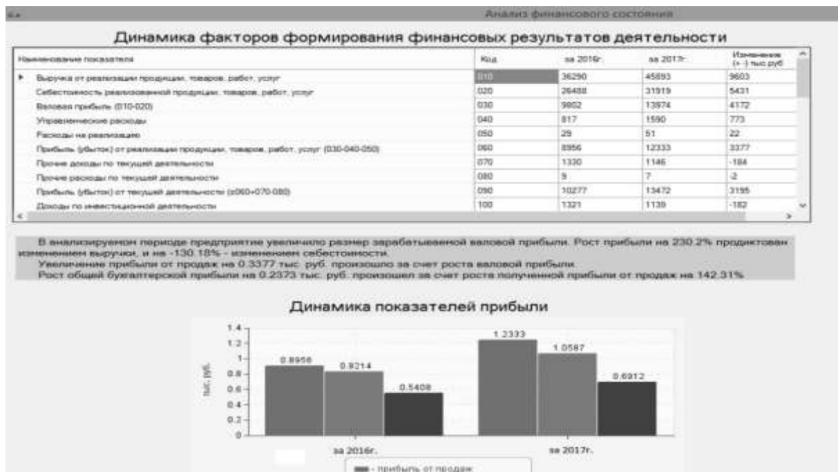
Рисунок 3 – Пример отражения выходных данных

Выходные данные отражаются в виде отчетов и графиков, показанных на рисунке 3.