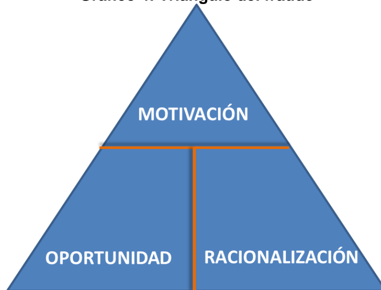
Gráfico 4: Triangulo del fraude