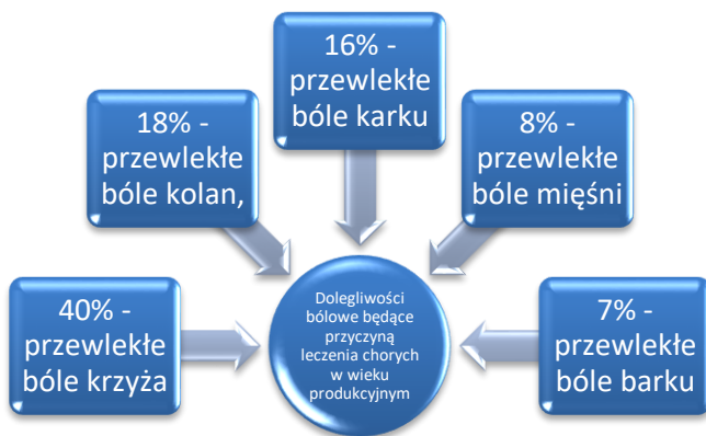
Rycina 1. Dolegliwości bólowe będące przyczyną leczenia chorych w wieku produkcyjnym [7,8]

W krajach Europy Zachodniej przewlekły ból jest najczęstszą przyczyną wizyt chorych u lekarza (ryc.1.).