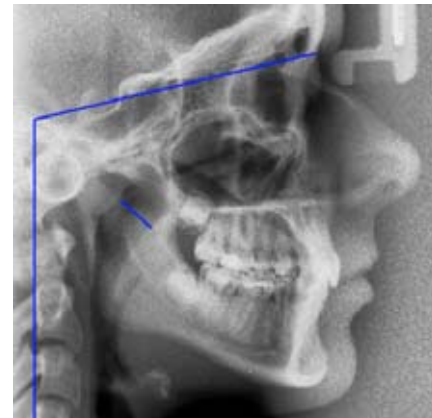
Rycina 2. Prawidłowa szerokość górnych dróg oddechowych (15 mm wg Holmberga; kąt czaszkowo-kręgowy 100°, mezorotacja żuchwy).

Figure 1. Correct head position and width of airways (11 mm according to Holmberg, craniospinal angle 92°, anterior rotation of the mandible).