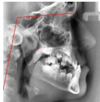
Rycina 4. Przeprostna pozycja głowy i prognatyczna żuchwa u pacjenta ze zwężeniem górnych dróg oddechowych na wysokości migdałka gardłowego (4 mm wg Holmberga; 106° kąt czaszkowo-kręgowy, anteriorotacja żuchwy).

Figure 3. Hyperextended head position and retrognathic mandible in a patient with upper respiratory tract narrowing at the level of the adenoid (4 mm according to Holmberg; craniospinal angle 108°, posterior rotation of the mandible).