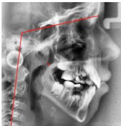
Rycina 3. Przeprostna pozycja głowy i retrognatyczna żuchwa u pacjenta ze zwężeniem górnych dróg oddechowych na wysokości migdałka gardłowego (4 mm wg Holmberga; 108° kąt czaszkowo-kręgowy, posteriorotacja żuchwy).

Figure 2. Correct width of the upper respiratory tract (15 mm according to Holmberg; craniospinal angle 100°, mesial rotation of the mandible).