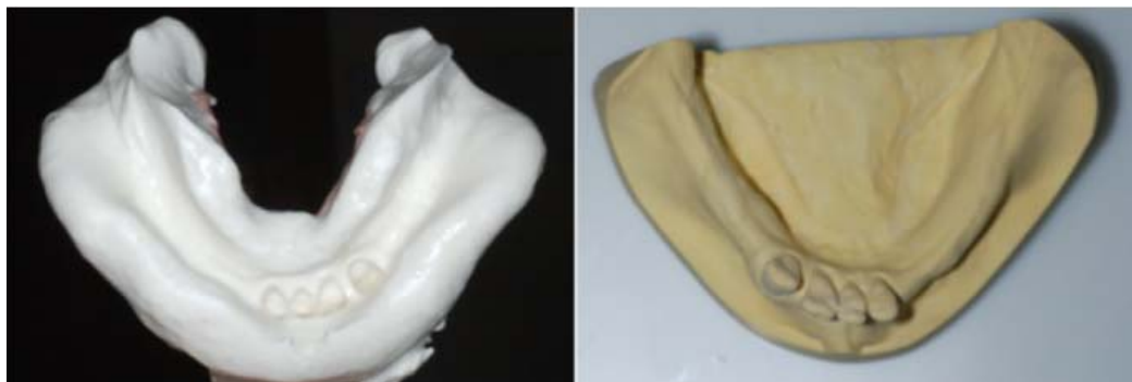
Rycina 8. Wycisk anatomiczny żuchwy i model roboczy dolny