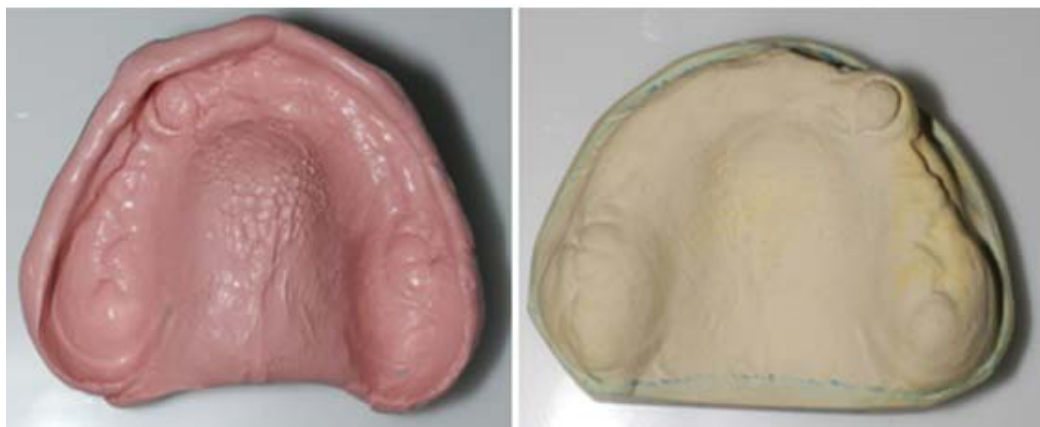
Rycina 9. Wycisk czynnościowy szczęki i model roboczy górny