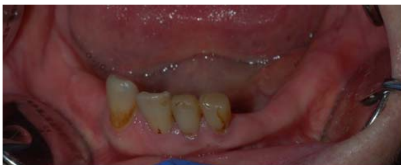
Rycina 4. Zdjęcie wewnątrzustne pola protetycznego w żuchwie Figure 4. Intraoral view of the denture supporting tissues in the mandible