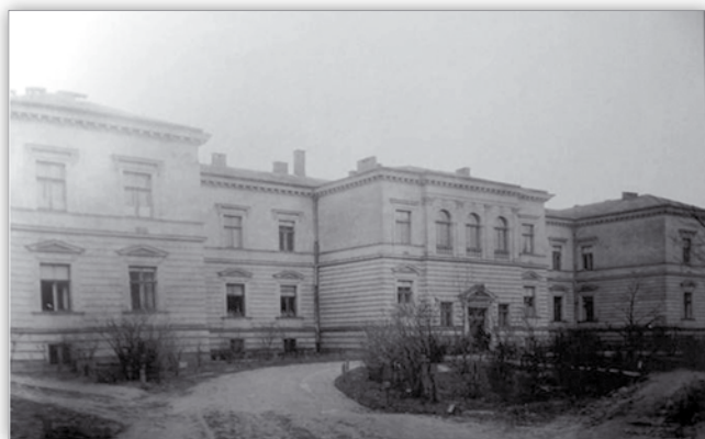
Ryc. 2. Budynek Kliniki Okulistyki z początku XX wieku. Fig. 2. Department of Ophthalmology at the beginning of XX century.

W 1895 roku Bolesław Wicherkiewicz został powołany na stanowisko profesora okulistyki i dyrektora Kliniki Okulistycznej