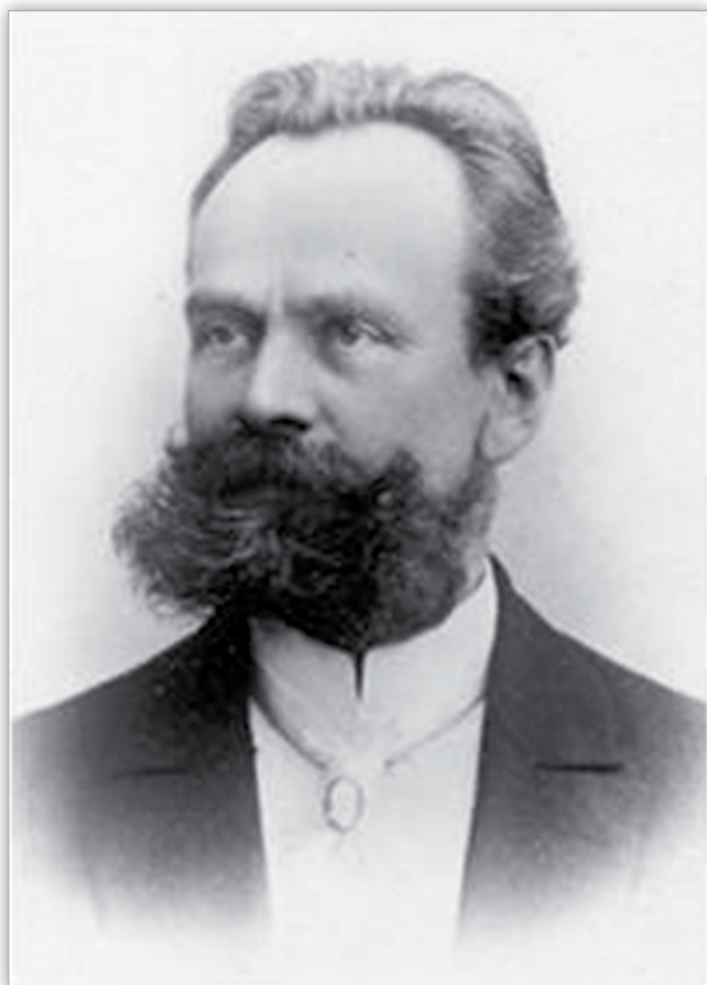
Ryc. 1. Portret Bolesława Wicherkiewicza. Fig. 1. Portrait of Bolesław Wicherkiewicz.

a następnie w lipcu 1877 roku bezpłatny Zakład Lecznicy dla Ubogich Chorych na Oczy. Początkowo w Zakładzie Lecznicy znajdowały się jedynie 2 łóżka. Z czasem placówka rozrosła się, powstał większy i nowoczesny zakład okulistyczny. W 1891 roku było tam już 75 łóżek, a w późniejszym czasie nawet 100. Był to wówczas jeden z największych szpitali okulistycznych na ziemiach polskich, który stał się krajowym zakładem leczniczym dotowanym przez władze poznańskiej prowincji (1, 2).