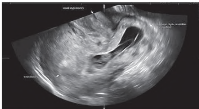
Rycina 2. Obraz uzyskany podczas badania dopochwowego pacjentki opisanej w przypadku nr 2. Jama macicy i kanał szyjki są puste. Zwraca uwagę pęcherzyk ciąży z widocznym echem zarodka uwypuklający się w stronę pęcherza moczowego. Trofoblast zlokalizowany jest w obrębie blizny macicy.

Uważa się, że występuje związek pomiędzy ciążą w bliźnie po cięciu cesarskim a przebyłym jatrogennym urazem endometrium.