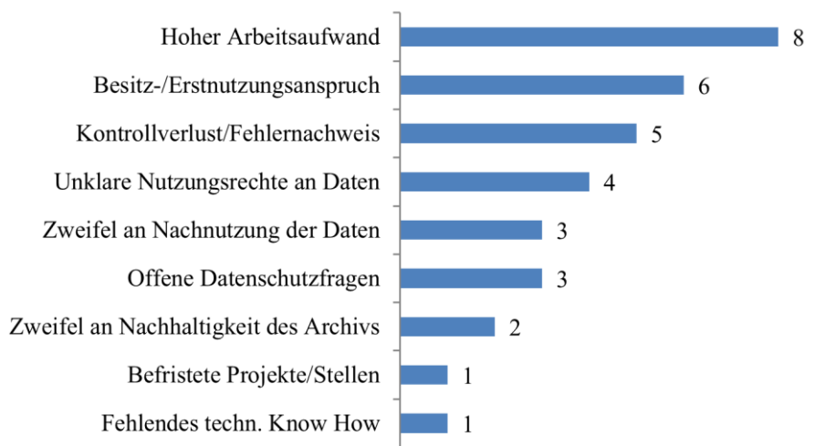
Abbildung 1. Bedenken der Forschenden sortiert nach Anzahl der Interviews mit entsprechender Nennung, N=10 (Patrick J. Droß)

stellen, die in der folgenden Abbildung aufgelistet sind. Mehrfachnennungen in einem einzelnen Interview wurden einfach gewertet.