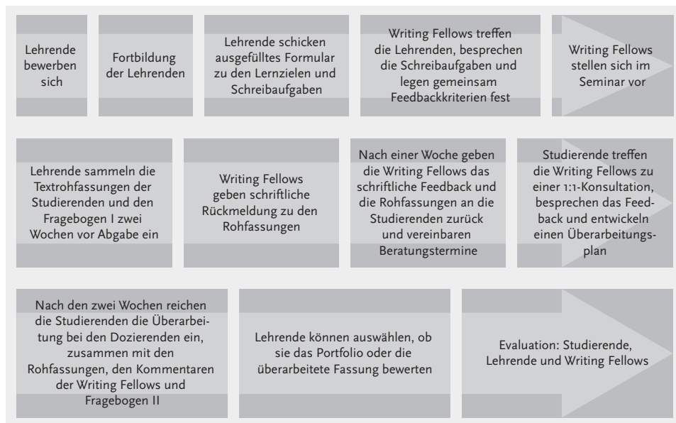
Abb. 1: Idealtypischer Ablauf des Writing Fellow-Programms

Bevor es nun wirklich losgeht, kannst du dir einen idealtypischen Ablauf eines Durchgangs im Writing Fellow-Programm als Abbildung ansehen.