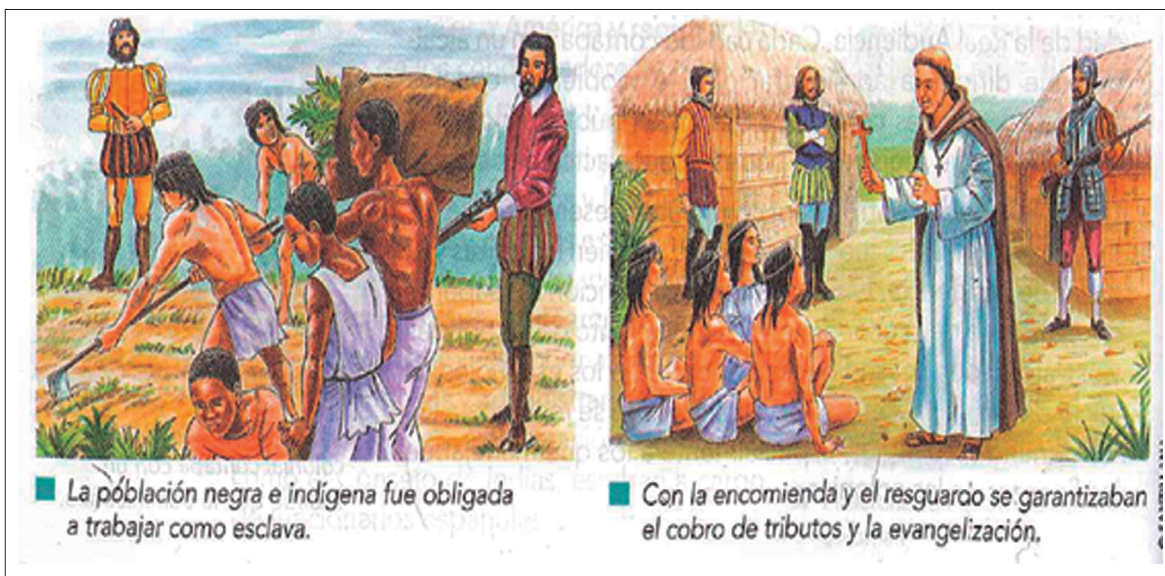
■ La población negra e indígena fue obligada a trabajar como esclava.

Las acciones colectivas se evidencian en los libros de texto desde actividades de carácter comunitario que desarrollan los grupos étnicos como la minga y la siembra.