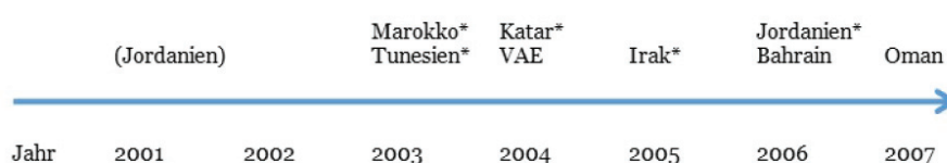
Grafik 1 Anti-Terror-Gesetze in arabischen Staaten nach 2001

In dieser ersten Verbreitungswelle nach den Anschlägen des 11. September 2001 lässt sich innerhalb der arabischen Welt eine Mischung aus innerstaatlichen und globalen bzw. regionalen Anlässen in Bezug auf die Einführung und Novellierung von Anti-Terror-Gesetzgebungen erkennen. Einerseits waren Staaten bestrebt, internationale und regionale Normen zu befolgen; andererseits wurden nach lokalen Terroranschlägen entsprechende Gesetze verschärft. Grafik 1 verdeutlicht die zeitliche Abfolge während dieser Phase.