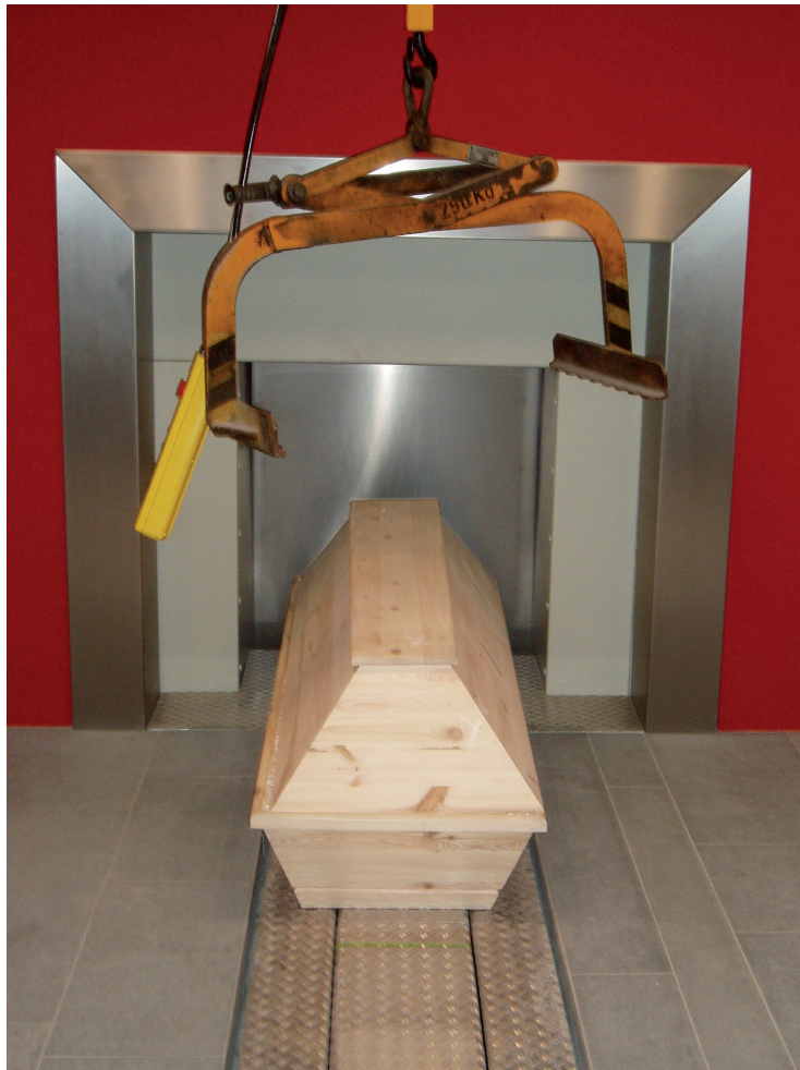
Abb. 3: Der Sarg vor dem Einfahren in den Verbrennungsraum (Dresden-Tolkewitz).

(1891) und Hamburg (1882). Bis zum Jahr 1910 stieg die Zahl der Krematorien in Deutschland auf über 20 Bauten (Winter 2001: 39-45; Heldwein 1931: 47-48). Sie bildeten im Übrigen eine völlig neue Bauaufgabe. Grundsätzlich standen die Architekten vor der Aufgabe, eine neue Technik, nämlich den Einäscherungsapparat, mit den herrschenden Formen bürgerlicher Pietät in Einklang zu bringen. Der Raum für die Trauerfeiern sollte dabei von der Technik möglichst wenig zeigen – die Feuerbestattungsbewegung befürchtete sicher nicht zu Unrecht den Vorwurf, Tod und Trauer mit einer weithin als „seelenlos“ betrachteten industriellen Technik in Verbindung zu bringen. Die meisten frühen Krematorien waren architektonisch vom Stilpluralismus des Historismus geprägt, erst im frühen 20. Jahrhundert entstanden moderne Bauwerke, etwa das von Peter Behrens entworfene Krematorium auf dem Remberti-Friedhof in Hagen/Westfalen (1909) und Fritz Schumachers 1911 fertiggestellte Krematorium mit angeschlossener Aschenbeisetzungsanlage in Dresden-Tolkewitz (Winter 2001: 87 ff.) (Abb. 2 und 3).