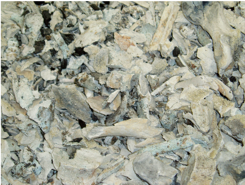
Abb. 1: Nach dem Einäscherungsvorgang: Knochenreste.

den in der Regel in Urnen gefüllt. Aus dem Lateinischen kommend („urna“), bedeutet der Begriff zunächst ein bauchiges Gefäß (Topf beziehungsweise Krug) (Großes Lexikon 2002, 1: 366, 2: 392). Als sepulkrales Symbol ist die durch den Klassizismus aufgewertete Urne seit dem späten 18. Jahrhundert verbreitet. Zunächst diente sie – zumeist aufgesockelt – dem Schmuck von Grabstätten. Daher konnte die Urne mit Einführung der modernen Feuerbestattung eine doppelte Funktion haben: sowohl Verwahrgefäß als auch – jedenfalls bei oberirdischer Beisetzung – Grabmal. In der Frühzeit der Feuerbestattung, als die oberirdische Beisetzung bevorzugt wurde, waren Stein, Keramik oder Metall beliebte Materialien für diese Schmuckurnen. Hingegen wurde bei der später vorherrschenden unterirdischen Aschenbeisetzung die Urne meist als reines, seriell gefertigtes Zweckbehältnis ohne repräsentativen Schmuck verwendet (Leisner 2003: 25).