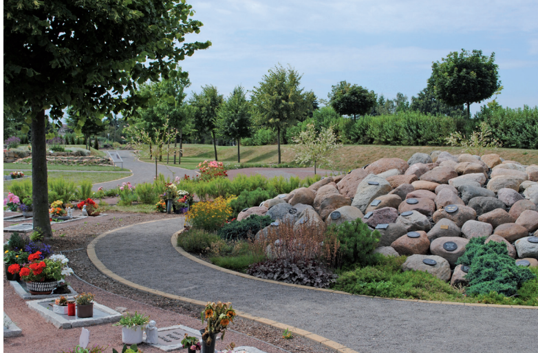
Abb. 6: Blick in den „Friedgarten“ Mitteldeutschland.

Auch neuere Aschenbeisetzungsanlagen, die nicht in der freien Natur liegen, zeigen eine weitgehende Auflösung der traditionellen, am Reihen- bzw. Familiengrab orientierte Friedhofsstruktur. Sie können eher als „Gedächtnislandschaften“ bezeichnet werden (Fischer 2016: 28-33; siehe auch Klie und Sparre 2016). Dies gilt beispielsweise für den um ein Krematorium („Flamarium“) angelegten „Friedgarten Mitteldeutschland“ in Kabelsketal bei Halle/Saale (Abb. 6).