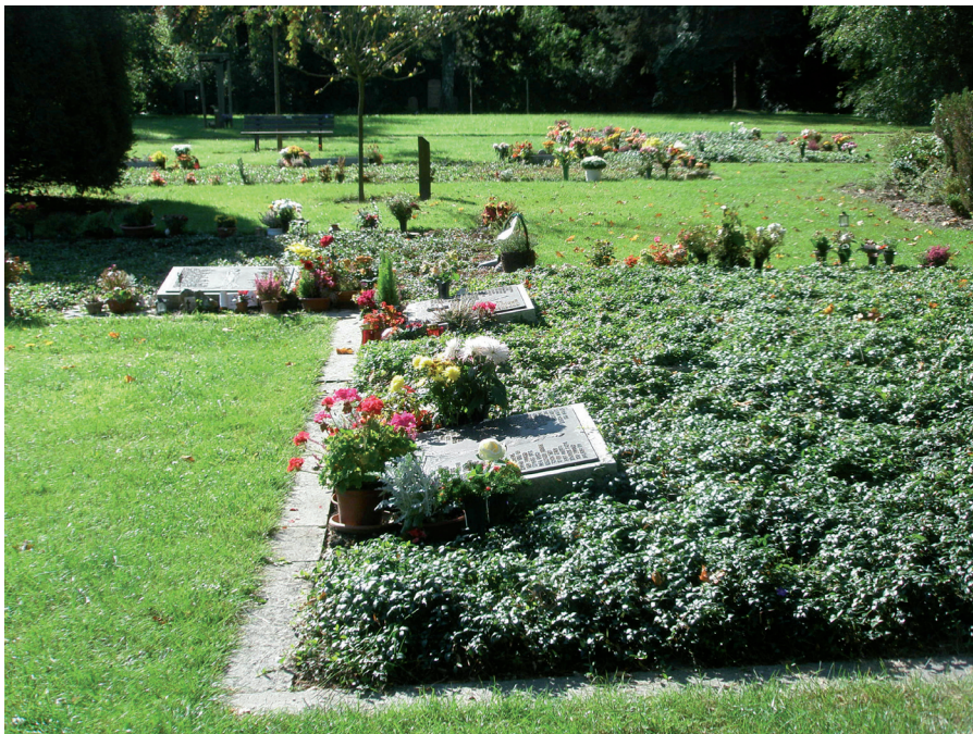
Abb. 5: Anonyme Rasenbeisetzungen auf dem Südfriedhof Leipzig.

2013). Gelegentlich sind auf einem Gemeinschaftsdenkmal die Namen aller Bestatteten verzeichnet, in anderen Fällen auf so genannten Jahresfeldern mit einem Gedenkstein die Bestattungen eines jeden Jahres markiert. Auf dem Leipziger Südfriedhof haben sich aus einem bereits früher für Sozial- und Anatomieleichen angelegten Urnengarten seit 1960 mehrere Urnengemeinschaftsanlagen entwickelt. In den alten Bundesländern ist ab 1970 eine signifikante Entwicklung der anonymen Bestattung als reguläre Bestattung zu beobachten: Frühe anonyme Urnenhaine in den westlichen Bundesländern entstanden beispielsweise 1970 auf dem Friedhof Hamburg-Öjendorf, 1974 in Bremen-Riensberg und 1975 auf dem Friedhof Hamburg-Ohlsdorf.