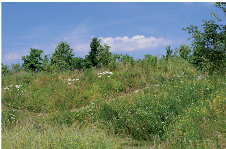
Abb. 7: Der einem Krematorium angeschlossene Naturfriedhof in Fürstenzell bei Passau.

Es ist ein homogen gestalteter Natur- und Kulturraum, in den Einzel- und Gemeinschaftsgrabstätten gleichsam hineinkomponiert sind. Durch spezielle Namensgebungen erhalten die einzelnen Bereiche eine spezielle Atmosphäre und Bedeutung.