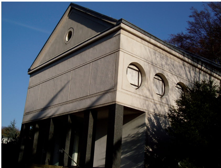
Abb. 2: Das vom Reformarchitekten Peter Behrens entworfene Krematorium in Hagen/Westfalen zählt zu den ersten modernen Bauten.