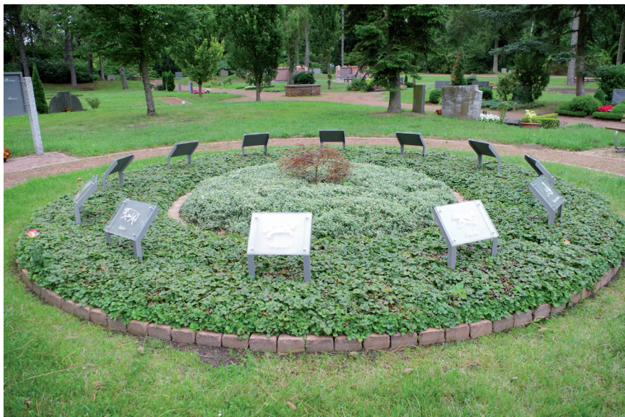
Abb. 8: Urnen-Themenanlage „Sternzeichen“, Hauptfriedhof Saarbrücken.

Auch Aschenbeisetzungsflächen auf Friedhöfen werden immer häufiger landschaftlich modelliert – ein bekanntes Beispiel ist der „Friedpark“ des Hauptfriedhofes Karlsruhe. Im Jahr 2006 wurde auf dem Hamburg-Ohlsdorfer Friedhof der so genannte „Ruhewald“ angelegt – eine rund zwei Hektar große verwilderte Fläche. In der Nähe von 80 markierten Bäumen können hier Aschenbeisetzungen stattfinden. Zum entsprechenden Beisetzungsbaum gehört eine in der Nähe aufgestellte pultartige Tafel, auf der die Art des Baumes und gegebenenfalls auch der Name der Beigesetzten verzeichnet sind. Die genaue Beisetzungsstelle hingegen wird mit einem ebenerdigen Granitpfosten markiert. Eine andere Tendenz repräsentieren die immer wieder neuen thematischen Varianten von Aschengemeinschaftsanlagen, beispielsweise die Themenanlage „Sternzeichen“ auf dem Hauptfriedhof Saarbrücken (Abb. 8).