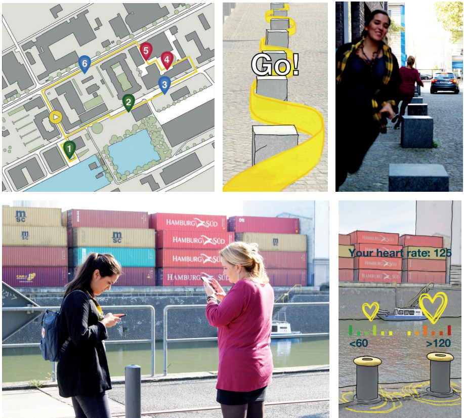
Abb. 2: Route, Screens und Teilnehmerinnen des LBG Stadtflucht in Aktion in Frankfurt Ost

Funktionsweise: Bei Stadtflucht handelt es sich um ein LBG, das gesundheitsfördernde Aspekte von Stadträumen thematisiert und in der mobilen Interaktion vor Ort erfahrbar macht (Halblaub Miranda/Knöll 2016). Die Teilnehmerinnen und Teilnehmer interagieren dabei mit anderen Spielern, dem Smartphone und der gebauten Umgebung auf einer rund ein Kilometer langen Route durch ausgesuchte Freiräume. Sie starten von einem gemeinsamen Treffpunkt mit dem Ziel, eine möglichst gekonnte Flucht aus der Stadt zu trainieren. Die Teilnehmerinnen und Teilnehmer balancieren beispielsweise einen virtuellen Gegenstand auf dem Smartphone entlang einer langen Laderampe und treten dabei gegen sich und die Bestzeiten anderer an. An weiteren Stationen können die Teilnehmerinnen und Teilnehmer Effekte der Umgebung auf den eigenen Puls kennenlernen, indem sie diesen an verschiedenen Orten mithilfe der Smartphone-Kamera messen (Abbildung 2).