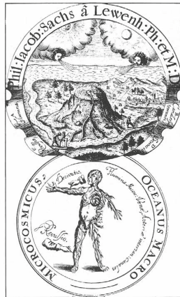
Abbildung 4: Frontispiz Oceanus Macro-Microcosmicus von Sachs von Lewenheimb (1664)

vom Typus derer, für die nach Blumenberg absolute Metaphern notwendig sind, um sie überhaupt vorstellbar zu machen, und zwar auf dem Weg einer Analogiebildung, „die mit dem Gemeinten nur die Form der Reflexion gemeinsam hat, nicht aber Inhaltliches.“ 55 Anders nämlich als existierende Organismen, die als zweckmäßig (und das heißt, wie Kant bemerkt: technisch) vorgestellt werden müssen, soll das Ganze der Natur als lebendig gedacht werden, um es als zweckmäßig organisiert denkbar zu machen. Es handelt sich also um eine „Übertragung der Reflexion über einen Gegenstand der Anschauung auf einen ganz andern Begriff, dem vielleicht nie eine Anschauung direkt korrespondieren kann,“ 56 dessen Gegenstand aber auf diese Weise erst vorstellbar gemacht wird. Diese Vorstellung wiederum ist notwendig, um die Stabilität optimaler Lebensbedingungen auf der Erde überhaupt erklären zu können – so das zentrale Argument der Gaia-Theorie.