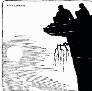
Abbildung 2: „Where the globe of the Earth glowed dimly“ – Doctor Dolittle in the Moon by Hugh Lofting, Philadelphia 1928.

have saved the day and brought happiness to all.' Lovelock's Gaia is very much the terrestrial equivalent of Lofting's lunar Council. But the Council was created by Otho Bludge, the first moon man and a refugee from Earth. Who created Gaia? 38