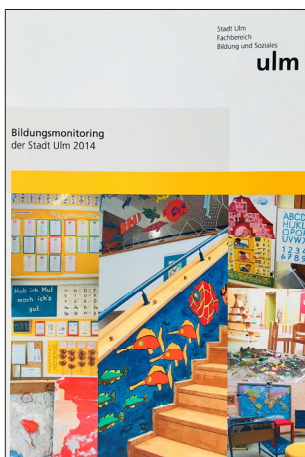
Abbildung 1: Titelseite des Bildungsmonitoring der Stadt Ulm 2014

Seit der Einrichtung des Bildungsbüros 2010 wurde aus den Kreisen des Gemeinderates immer wieder die Forderung nach einem Bildungsmonitoring geäußert.