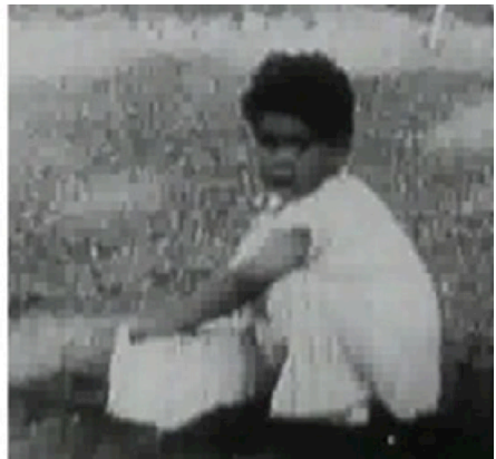
Abb. 2: Standbilder aus Hanna und der Stein (1922)