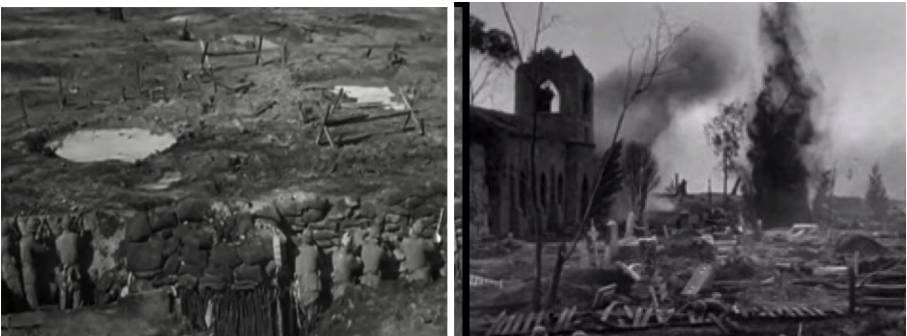
Abb. 1: Ausschnitte aus All quiet on the western front (Milestone, 1930)

ger, kurz: als »Gefechtsdinge«, deren ziviler Gebrauchs- oder Tauschwert während des Gefechts völlig verschwindet. Wird der Stellungs- zum Bewegungskampf, so dynamisiert sich die Kriegslandschaft, im Sturmlauf verflüssigt sich die Grenze und verschiebt sich nach vorne bis zum nächsten Hügel, Wald oder Graben. Krieg und Frieden schlagen sich in Lewins Darstellung als Konfigurationen psychologischer Kräftefelder nieder, welche die Landschaft strukturieren und begrenzen, den Soldaten in bestimmte Richtungen locken, von anderen fernhalten und die ihm zuhandenen Gegenstände als Kriegs- oder Friedensdinge erscheinen lassen.