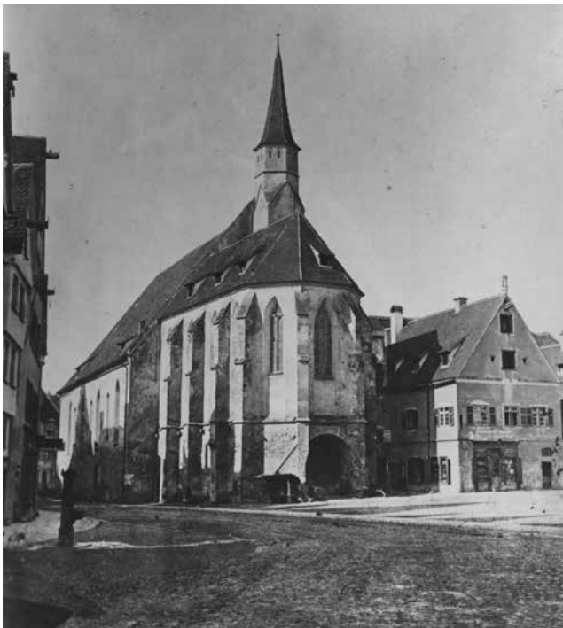
Abbildung 1: Der westliche Münsterplatz mit der ehemaligen Franziskanerkirche (Barfüßerkirche). Foto um 1875