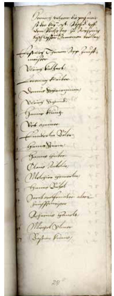
Abbildung 2: „Hernach volgen die personen, so der kayserlichen Mayestat Abschied uff dem Reichstag zu Augspurg beschlossen, nit annemen wöllen...“ Aus der Abstimmungsliste der Fischerzunft vom November 1531. 65 der Zunftmitglieder stimmten gegen, 14 für den Reichstagsabschied.

Die Abstimmung fand vornehmlich in den Zunftstuben statt. Dort wurde zunächst ein Text des Rates verlesen, der die Verantwortung der Stimmbürger für Wohl und Heil der Stadt drastisch verdeutlichte: Bei Widerspruch gegen den Kaiser – den Stadtherrn! – drohe „sterben, verderben, bluetvergießen, zerstörung unser statt [...] wegfuehung unser weiber und kinder“ 6 . Wer aber „mit verdachtem mut wider sein aigen consientz und gewissen“ 7 für den Abschied stimme, der provoziere den Zorn Gottes. Anschließend waren die Zunftmitglieder gefragt, ihre Stimmen einzeln, namentlich abzugeben. Jede Zunft verzeichnete das Ergebnis auf einer eigenen Liste, die dem Rat übergeben wurde, ebenso die Versammlung der Patrizier. 8 Das Ergebnis war eindeutig: Von 1865 Ulmern stimmten 1621 gegen den Reichstagsabschied – und damit für die Reformation ihrer Stadt.