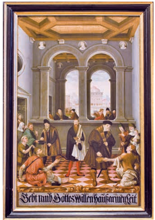
Abbildung 4: Von Eitel Eberhard Besserer gestiftete Almosentafel im Münster, Georg Rieder d.Ä., 1562 (Ev. Gesamtkirchengemeinde Ulm)

nikaner auf jeweils 13 an. 1527 wurden einige bedeutende Prozessionen, unter anderem die Fronleichnamsprozession, aufgehoben. 1528 untersagte der Rat den Bettelmönchen das Umhergehen in der Stadt – außer zum Marktbesuch –, das Predigen wurde ihnen generell verboten und die Messe durften sie nur noch klosterintern feiern. 1531 schließlich verließen die Mönche mehr (Augustinerchorherren, Franziskaner) oder weniger friedlich (Dominikaner) die Stadt; ihre Gebäude wurden umgenutzt (Franziskanerkloster, s. o.) oder dem Verfall preisgegeben (Dominikanerkloster). 18 Prozessionen fanden nicht mehr statt. Und da auf der Grundlage des reformatorischen „Christus allein“ jegliche Heiligenverehrung ihre Plausibilität verloren hatte, wurden die vorwiegend der Heiligenandacht gewidmeten Kapellen vor den Toren der Stadt zum Abbruch freigegeben. Übrig blieb die Pfarrkirche der Stadt, das Münster, als der eine, zentrale Gottesdienstort der Ulmerinnen und Ulmer. Zugeordnet waren ihm noch die Spitalkirche, in der Münsterprediger Gottesdienste für die Kranken hielten, sowie dann auch die Barfüßerkirche, die für Beerdigungsgottesdienste genutzt wurde.