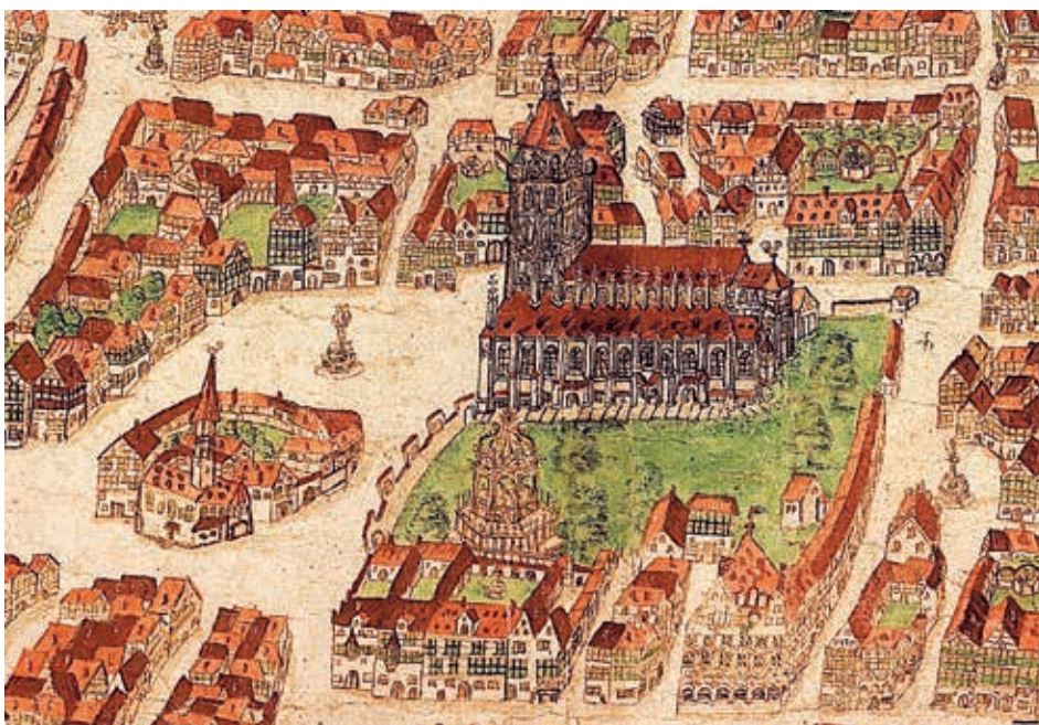
Abbildung 3: Ulm aus der Vogelschau von Süden (Ausschnitt). Der Ulmer Stadtmaler Philipp Renlin erstellte 1597 diesen „amtlichen“ Stadtplan. Kolorierte Federzeichnung (Ulmer Museum). Auf dem westlichen Münsterplatz ist der Gebäudekomplex des ehemaligen Franziskanerklosters zu sehen, in dem die Lateinschule, die Hochschule und der Armenkasten untergebracht wurden.

Die bereits in der „Supplication“ der Bürger von 1524 (s. o.) formulierte reformatorische Einsicht, dass jeder seinen Glauben aufgrund der Schrift selbst zu verantworten habe, wurde zum wichtigen Impuls sowohl für die Breitenbildung als auch für die Ausbildung einer theologischen Elite, die in der Lage sein würde, in Stadt und Land reformatorisch zu predigen. So verfasste Konrad Sam im Auftrag des Rates 1528 einen Katechismus, der mehrere Jahrzehnte lang in der deutschen Schule als Grundlage für den Lese- und Schreibunterricht diente. Der Abschnitt der Kirchenordnung über die Schulen betont, dass „(d)ie jugent ye der ho(e)chst schatz ist, den wir haben“, und leitet daraus die Aufgabe des Rates ab, für qualifizierte Päd-