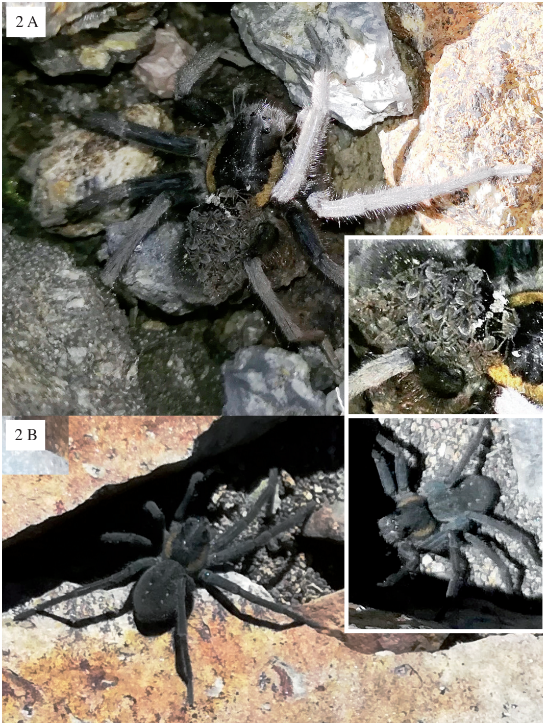
Figura 2. Ejemplares de Aglaoctenus puyen Piacentini registrados en el cerro Tronador, Chile. A) Hembra en su escondite circunstancial (a la derecha, abajo, se amplía el área abdominal de este ejemplar, donde se ven las crías). B) Macho en el sitio en que permaneció el tiempo de nuestra observación (a la derecha, arriba, otra imagen en detalle). La hembra parecía próxima a los 3 cm de longitud (cefalotórax más abdomen) y el macho apenas más pequeño; acorde a la publicación de Piacentini (2011), donde se describe la especie, dicha medida varía entre 19,82-21,55 mm.