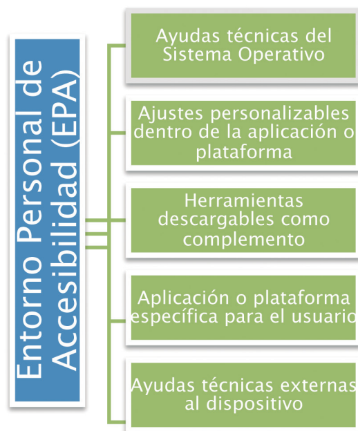
Figura 2. Posibilidades del Entorno Personal de Accesibilidad

rio en cuestión. Estas herramientas recogen todos aquellos ajustes que los dispositivos móviles incorporan en los dispositivos móviles.