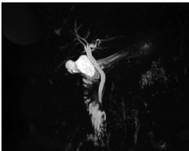
2. ábra | Mágnesesrezonancia-kolangiopankreatográfia